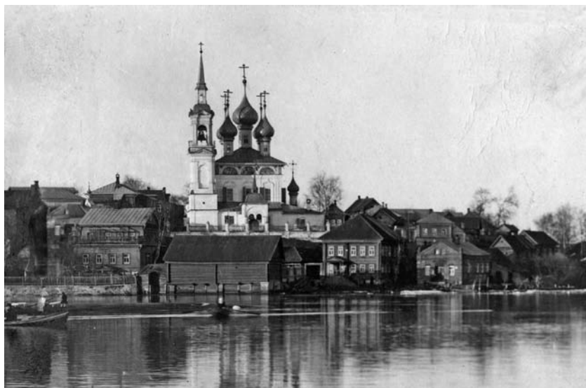
Большие Соли, вид на Богородице-Рождественскую церковь. Фото начала XX века.

чиков иконостасов Трубниковых, художников П. и Е. Сорокиных, А. Баженова, А. Демидова. Занимался строительством и правнук С. Воротилова — С.П. Воротилов, построивший в 1840-е годы гостиные ряды в Больших Солях 4 .