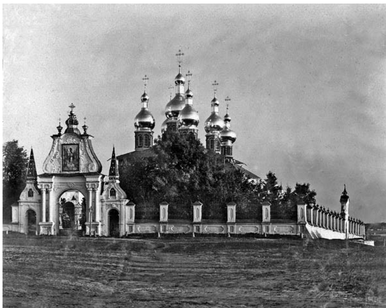
Успенский собор и Святые врата. Фото С. М. Прокудина- Горского, 1910 год.

«Несомненно, некогда храм был значительно меньшим; войдя в него, молящийся мог видеть лишь два столба, а другие два скрывались за иконостасом» 14 .