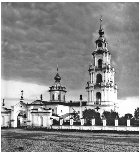
Богоявленский собор и колокольня. Фото В. Н. Кларка, 1906–1908 годы.

К настоящему времени подготовлен детальный план воссоздания всех сооружений кремлевского ансамбля – соборов, ограды с вратами, Царской беседки.