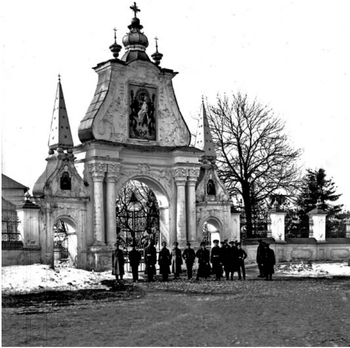
У Святых ворот. Фото начала XX века.