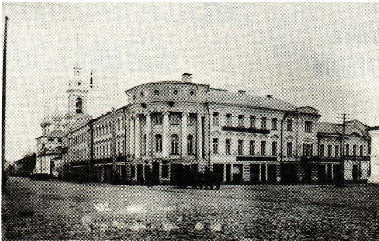
5. «Старый двор». 1915 год.

— Куда господа изволят? В гостиницу. Это мы мигом.