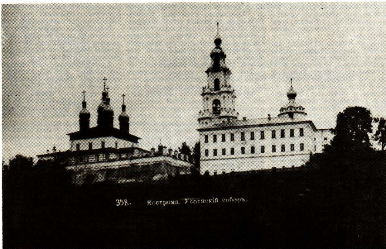
398. Кострома. Успенский собор.