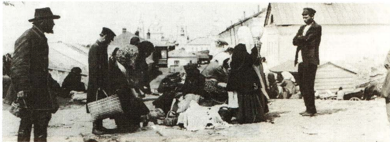
13. Воскресный рынок. Начало века