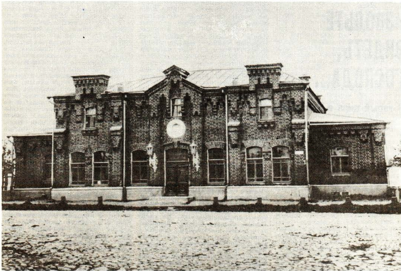
15. Читальня А. Н. Островского. Начало века.

(По материалам Отчета по постройке в г. Костроме здания народной читальни имени А. Н. Островского. Кострома, 1900 г.).