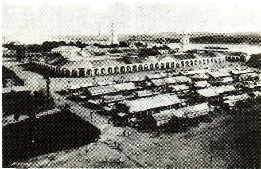
12. «Девятая ярмарка» 1908 г.

Ярмарка была праздником для всех — сюда спешили, чтобы выгодно продать и купить товар, заботливые хозяйки запасались на ярмарках всем необходимым, тем, чего нельзя было достать в обыкновенные дни. Здесь встречались давно не видевшие друг друга знакомые. В город съезжались не только торговцы и крестьяне, но и большая часть по-