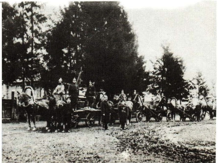
7. Пожарный ход. 1912 год

(Из отчета о деятельности Костромского Добровольного пожарного общества за 1908 г.).