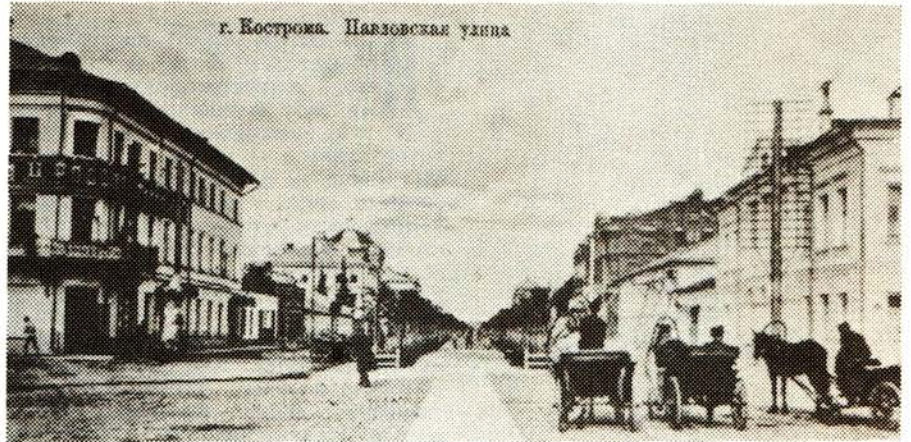
4. Биржа извозчиков. Фото М. Ф. Риттера. 1915 год

ния пассажиров, вставая где и кому как вздумается. Такое самовольство нередко беспокоило обывателей и они, находя такие стоянки неудобными для себя, высказывали недовольства. Для устранения такого нежелательного явления городская дума совместно с полицией объявила биржам места. Главные легковые стоянки извозчиков утвердили: на Сусанинской площади, в начале Павловской улицы, на Воскресенской площади, у водонапорной башни, в начале Русиной улицы, у Старого двора, у паровозных пристаней и перевоза. Правилами биржевой стоянки извозчикам предписывалось: «вести себя прилично, не допускать игр, не брани, стоять в порядке (ровно в ряду), не производить никакого шума и быть всегда в трезвом виде». Извозчикам воспрещалось «беспокоить публику своими предложениями, а должны они выжидать требования». Ломовые извозчики на легковые биржи не допускались, они имели свои места стоянки.