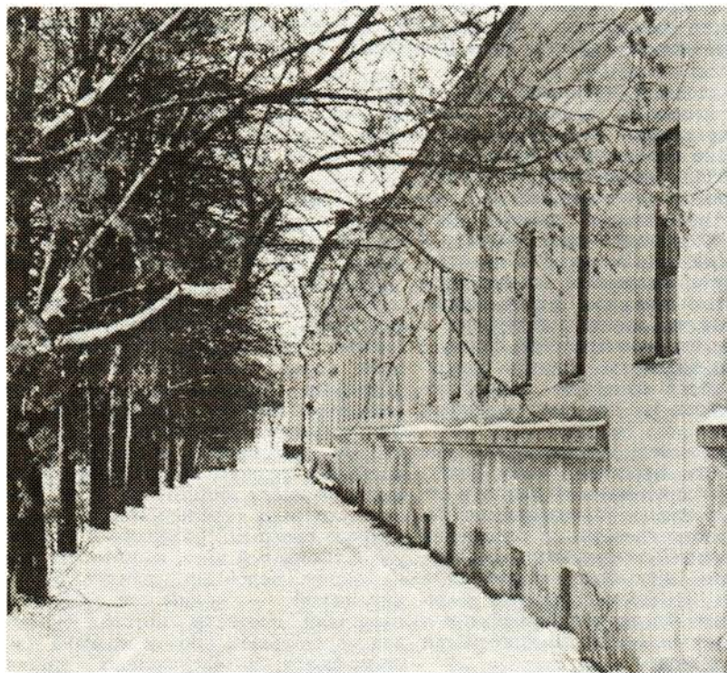
9. Бани Зимина. Вид от Волги.

А теперь с легким паром! Но не забывайте: вредно париться натощак или после обильной еды. Перед баней лучше поест немного овощей. Перед входом в парилку можно ополоснуться, но не мыться с мылом и не мочить голову, лучше надеть шерстяную шапочку и время от времени смачивать ее холодной водой. Нельзя пить холодных напитков, особенно залпом, нет ничего вреднее как пить во время бани или сразу после нее спиртное. Вот теперь парьтесь на здоровье!