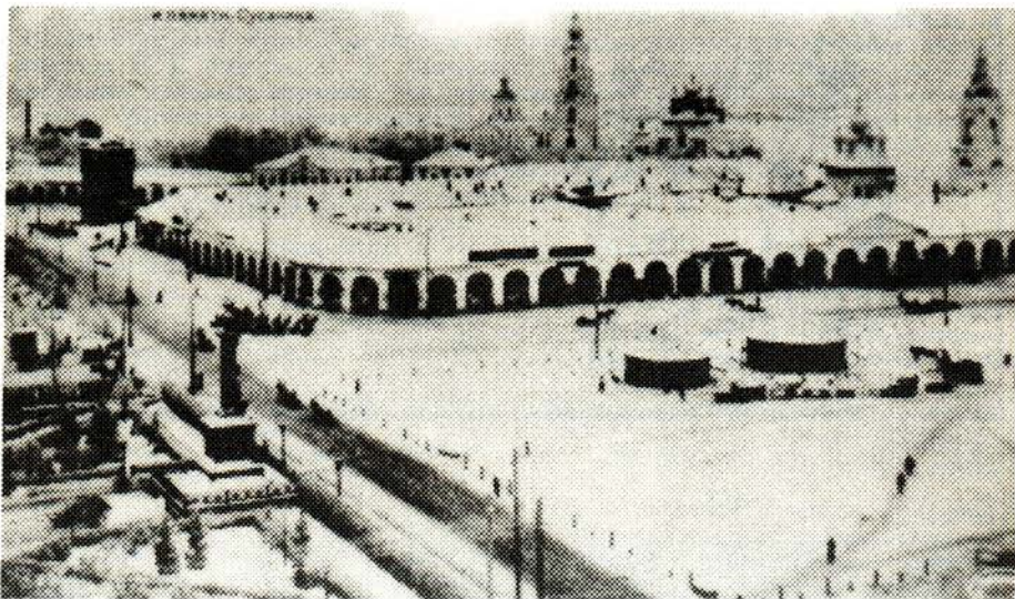
16. Вид с пожарной каланчи на городской плац с цирковыми балаганами. 1916 год.

До 1891 года в Костроме не предпринималось попыток строительства цирковых зданий, весной девяносто первого темирханшуринский мецза-