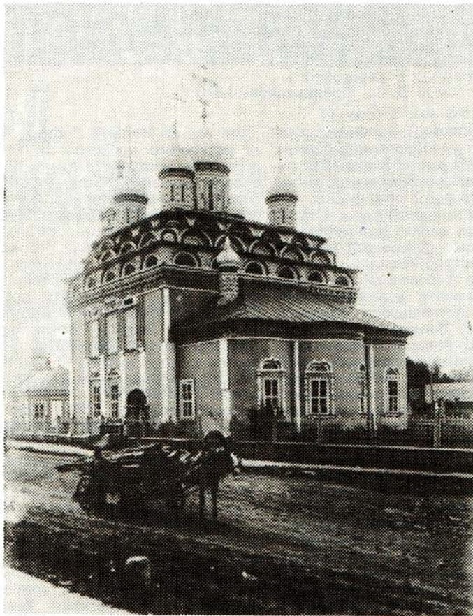
11. Троицкая церковь. 1908 г.