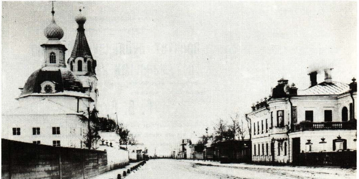
14. Улица Никольская (Александровская). 1910-е годы

Улица Свердлова еще в первой половине прошлого века имела немало интересных каменных построек. К сожалению, лютый сентябрьский пожар 1847 г. особенно опустошительно прошелся именно по этой улице, да и начался на ней (на месте дома № 5). В результате пожара некоторые обгорелые каменные здания осыпались и больше не восстанавливались, а разоренные хозяева возводили на освобожденных участках деревянные дома. Первоначальная деревянная застройка улицы тоже была уничтожена огнем почти целиком.