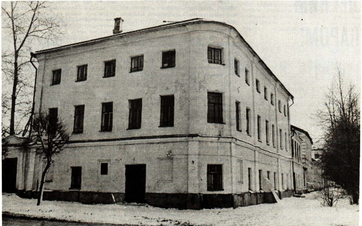
8. Бани Зимина, ул. Горная, 29.

поделенными на места. Здесь за порядками наблюдал банщик. Моечное помещение — такая же большая зала с парильным отделением. Любители париться на полках, веники, если не запаслись собственными, приобретали у банщиков. Они продавали их по сортам: березовый — одной цены, дубовый — другой... При народных отделениях всегда отирались бесплатные цирюльники, готовые стричь и брить за пониженную плату. Банщики разрешали им незаконную деятельность за заранее оговоренную плату. Поскольку парикмахерских при банях не имелось, то «постригальщики» без работы не бывали. Мастера-парик-