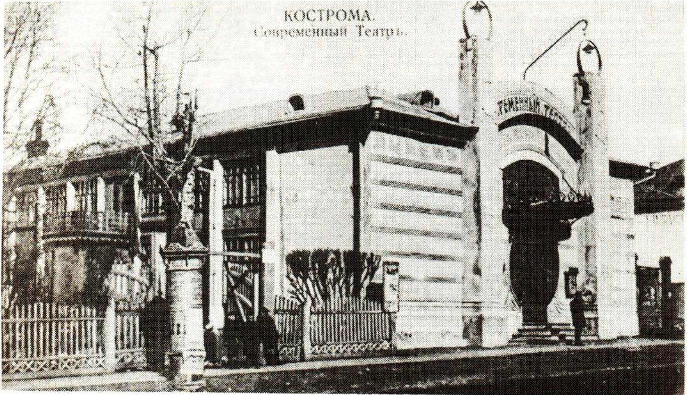
6. «Современный театр». Фото Д. И. Приячичкова, 1910 год

Владелец нового кинематографа постарался отмежеваться от прежнего, «ярмарочного» репертуара. Только «разумные развлечения», только «имеющие безусловно воспитательное значение!» Простойные мелодрамы перемежаются видовыми картинами («Прогулки по озерам Швейцарии»), а комедии с участием Макса Линдера сменяют научные фильмы («Изучение деятельности желудка при помощи ИКС—лучей»). И научные фильмы потрясают ничуть не меньше, чем мелодрамы: «16 октября 1-й раз пойдет монополярная картина акционерного общества «Аполлон» «Операция переливания крови». Дирекция рекомендует лицам нервным не приходиться» («КЖ», 1910, 16 октября). Проводятся целые научные сеансы, во