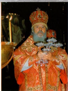
СВЯТЕЙШИЙ ПАТРИАРХ АЛЕКСИЙ II 9 мая 1993 г. посетил Успенское подворье

В 1893 г. в Домнино построено двухэтажное кирпичное здание церковно-приходской школы; при школе были устроены приют, мастерские для мальчиков и рукодельные для девочек.