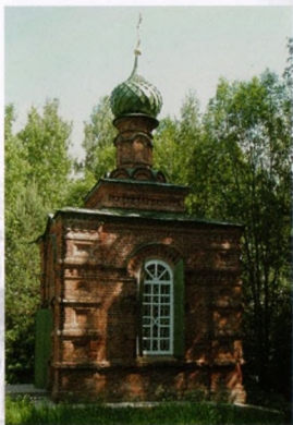
ЧАСОВНЯ ВО ИМЯ СВ. ПР. ИОАННА ПРЕДТЕЧИ, построенная в 1913 г. на месте дома Ивана Сусанина в память 300-летия его подвига