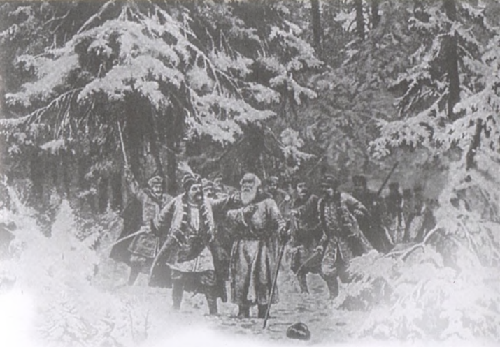
Картина художника А. Земцова "Подвиг Ивана Сусанина"