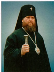
АРХИЕПИСКОП КОСТРОМСКОЙ И ГАЛИЧСКИЙ АЛЕКСАНДР, по благословению которого в 1991 г. в с. Домнино было создано Успенское подворье Костромского Богоявленско- Анастасиина женского монастыря