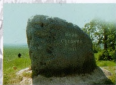
ПАМЯТНЫЙ КАМЕНЬ на месте гибели Ивана Сусанина