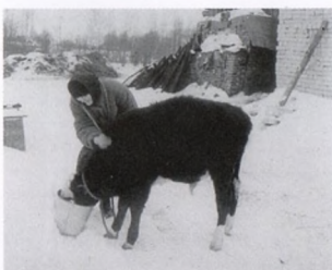
На ферме Успенского подворья