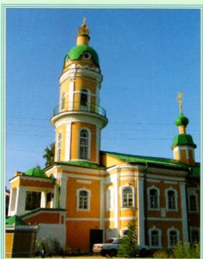
Храм Костромской Духовной Семинарии во имя преподобного Алексея, человека Божия. Фото 2005 г.

которая была жалована близ находящемуся женскому Свято-Анастасиину монастырю государем Михаилом Фёдоровичем Романовым в 1627 году.