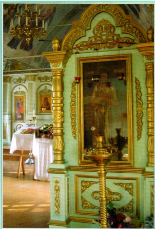
Храмовая икона прп. Алексия, человека Божия.

замазали краской. После такой варварской перестройки в священных стенах устроили общежитие для рабочей молодежи.