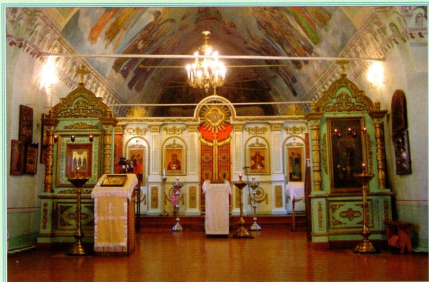
Под сводами Алексеевского храма. Фото 2005 г.

Однако, в октябре 1929 года, она разделила печальную судьбу большинства русских храмов – была закрыта и разорена. Уже через год здание было невозможно узнать – колокольню снесли, главку, венчавшую храм, уничтожили, настенные росписи