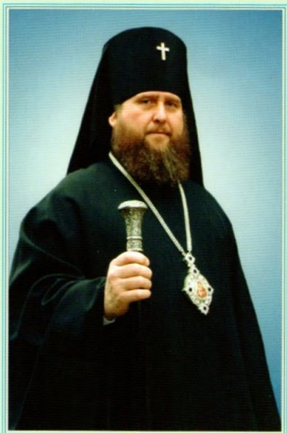
Архиепископ Костромской и Галичский Александр