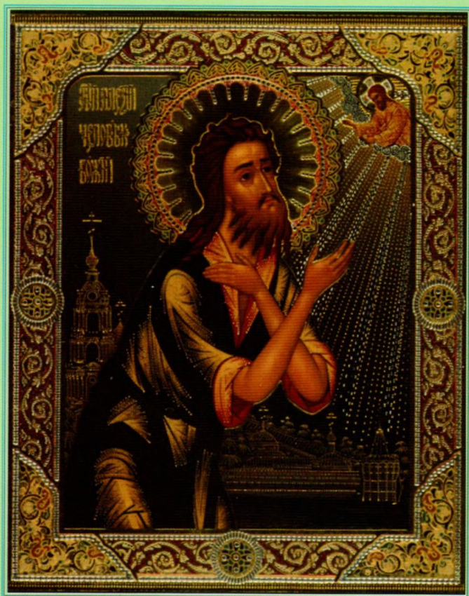
Икона прп. Алексия, человека Божия.