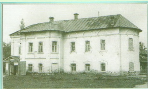
Общезитие, устроенное в святых стенах храма. Фото 1946 г.

кованая корона, которая увенчивает колокольню храма. Такой чести удостоивались многие храмы на Руси.