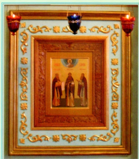
Храмовая икона прпп. Зосимы, Савватия и Германа, Соловецких чудотворцев.