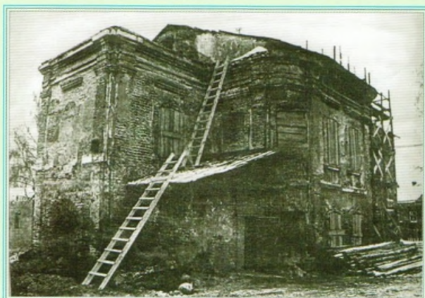
Храм прп. Алексея, человека Божия, после закрытия. Фото 30-х годов XX века.

Михайлович (Тишайший). Очевидно, именно последнее событие стало основанием для постройки в Костроме,