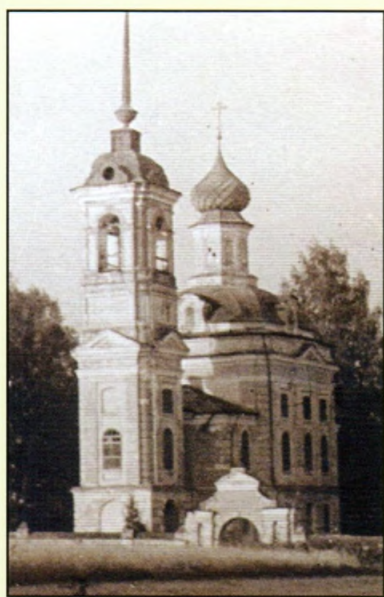
Фото начала XX века

По существовавшей традиции, когда деревянный храм ветшал от старости, его заменяли новым (последний деревянный храм был построен в 1700 году). В 1792 году была освящена каменная Никольская церковь, о чем упоминается в Кратких статистических сведениях о приходских церквях Костромской Епархии: «церковь зданием каменная, двухэтажная, с каменными же колокольнею и оградой, кладбище в церковной ограде. Престолов 3: а) вверху — святителя Николая Чудотворца,