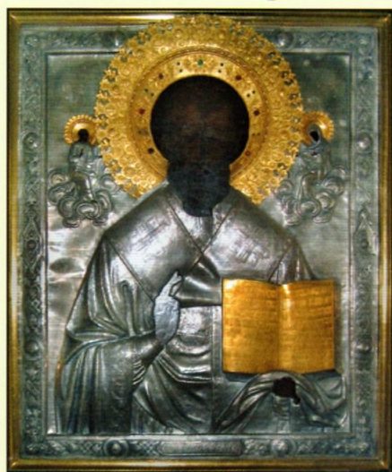
Храмовая икона святителя Николая Чудотворца

Главную причину постройки храма сохранило предание тех времен. Ф.М. Кутузов, в чине полковника лейб-гвардии Преображенского полка участвовал в русско-турецкой войне (1768—1774). Со своим сухопутным батальоном в составе знаменитой Средиземноморской (Архипелагской) экспедиции под командованием графа А.Г. Орлова-Чесменского посажен был в Италии на корабль и направлен освободить от турок остров Парос в Эгейском море. Судя с десантом попали в жестокий шторм. Кутузов дал обет: если спасется от морской пучины — построит