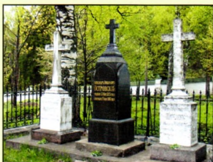
Семейное захоронение Островских

Никольская церковь действовала до 1938 года, по 1945 год была закрыта. В День Победы 9 мая вновь открыта для богослужений. Постановлением Совета Министров РСФСР № 1327 от 1960 года церковь во имя святителя Николая взята под государственную охрану как памятник архитектуры республиканского значения. В 1961 году приход остался без священника, храм был передан местному сельсовету, а в 1964 – Государственному музею-заповеднику А.Н. Островского «Щельково».