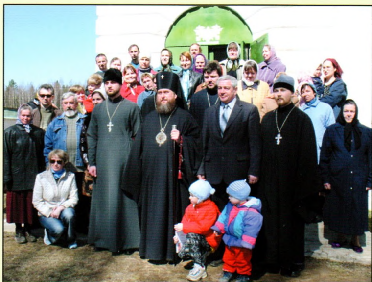
Архипастырь с причтом и прихожанами храма