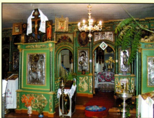
Вид нижнего зимнего храма