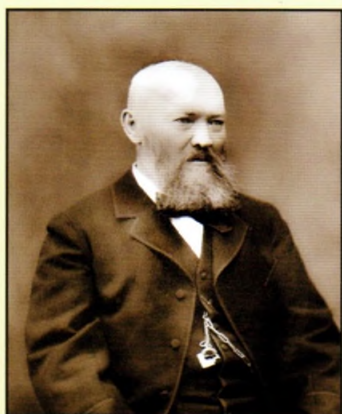
А.Н. Островский (1823 - 1886 гг.)