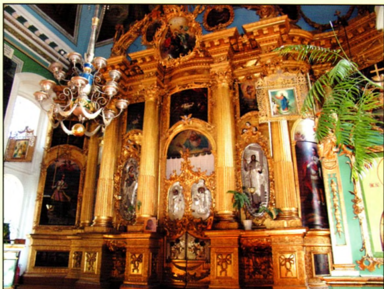
Иконостас летнего храма во имя святителя Николая, архиепископа Мир Ликийских

в родовом Щельковском имении вместо деревянной каменную церковь во имя святителя Николая Чудотворца, который по житию его почитался и покровителем терпящих бедствие на море. Судно одолело стихию, поставленная задача была выполнена. Кутузов был награжден орденом св. Георгия Победоносца IV степени, и, выйдя в отставку в чине генерал-майора, вернулся в усадьбу и исполнил свой обет.