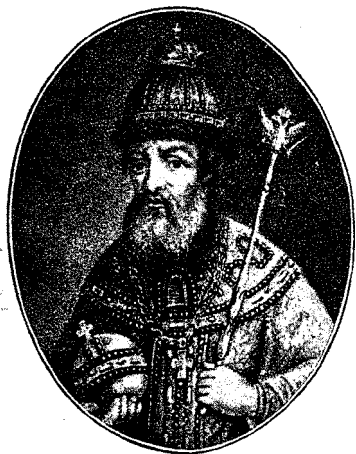
Царь Иоаннъ Васильевичъ IV.