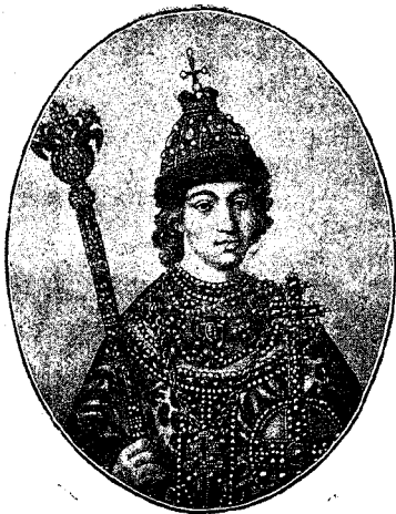
Царь Михаилъ Федоровичъ