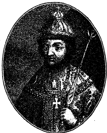
Царь Феодоръ Алексѣевичъ.