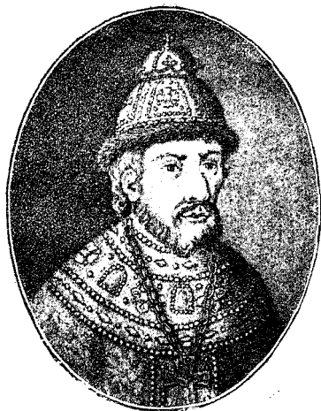
Царь Георгіъ Іванновичъ