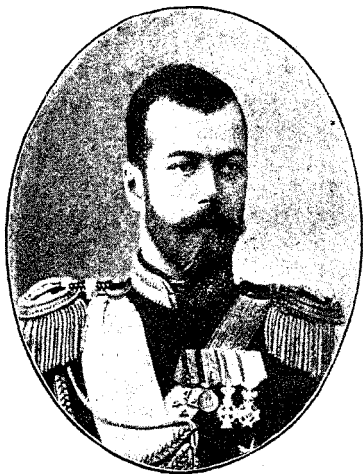
Его Императорское Величество Госудинь Императоръ НИКОЛАИ АЛЕКСАНДРОВИЧЪ Самодержецъ Всероссійскій.