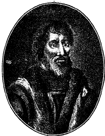
Великий Князь Всеволодъ II.