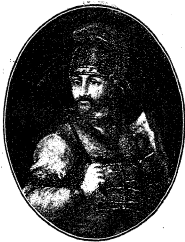
Великий Князь Рюрикъ.