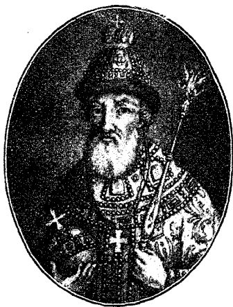
Царь Василій Іоанновичъ Шуйскій.