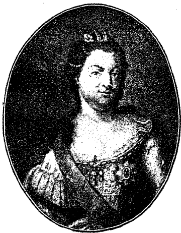
Императрица Екатерина I.