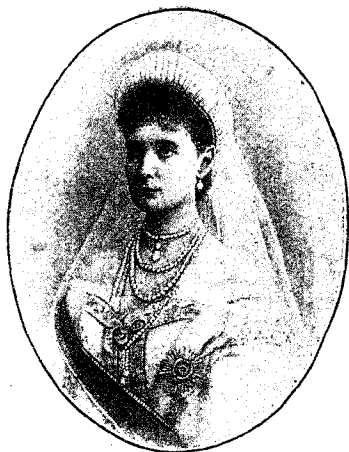
Ея Императорское Величество Государыня Императрица АЛЕНСАНДРА ФЕОДОРОВНА.