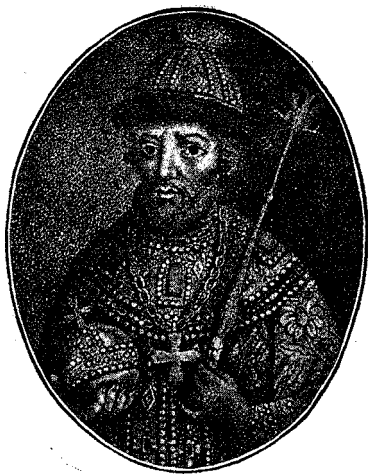
Царь Борисъ Феодоровичъ Годуновъ.