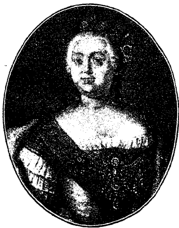
Императрица Елисавета Петровна.