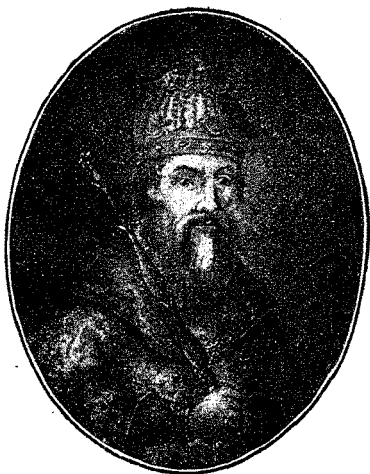
Великій Князь Владиміръ II Мономахъ.