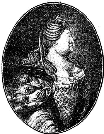
Императрица Анна Иоанновна.