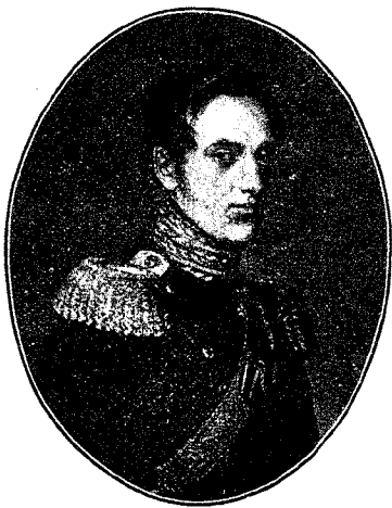
Императоръ Николай I.