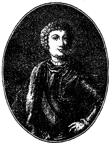
Императоръ Петръ II.