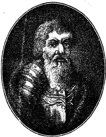
Великій Нязьъ Василій II.