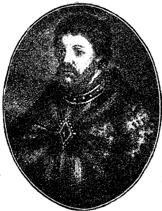
Царь Иоаннъ Алексѣевичъ.