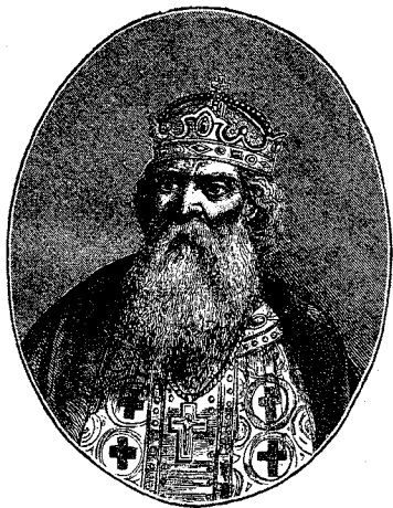
Святой Равноапостольный Князь Владимиръ.