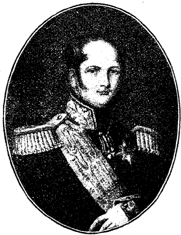
Императоръ Александръ I.