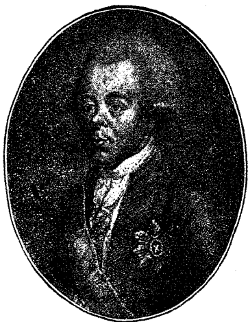
Императоръ Павелъ I.