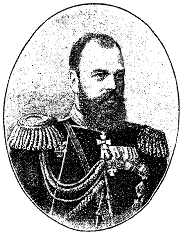
Императоръ Александръ III.