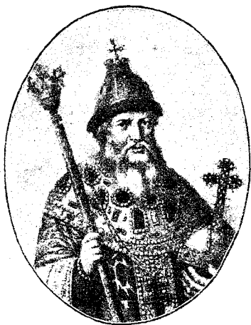
Царь Алексѣй Михайловичъ.