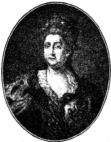
Императрица Екатерина II.