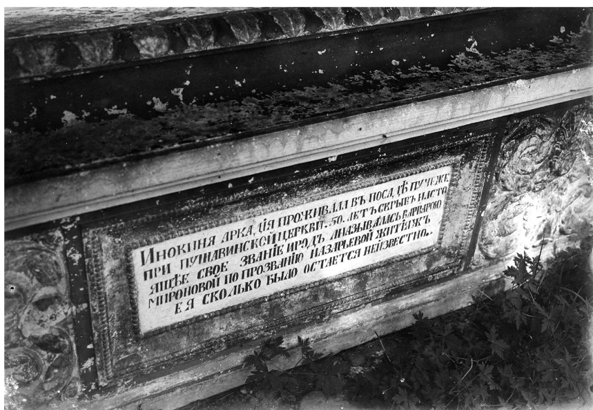
Гробница инокини Аркадии в ограде Воскресенской церкви на Пушавке 1908 г. Пучеж