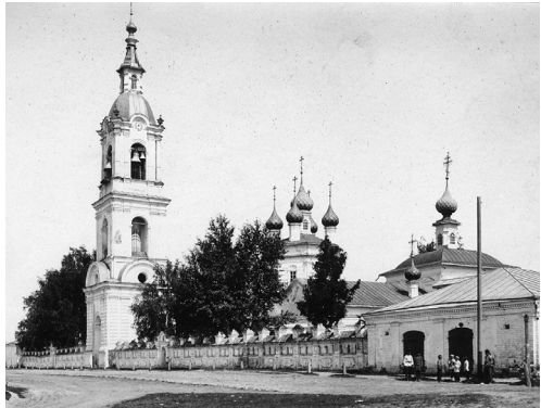
Виды Воскресенской церкви, что на Пушавке Фотографии В. Н. Кларка. 1908 г. Пучеж