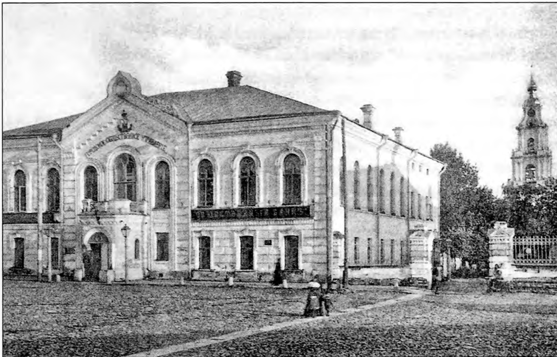
Кострома, здание городского общественного управления. Здесь 29 марта 1898 года состоялось торжественное открытие костромского отдела Палестинского общества. Фото с открытки начала XX века.