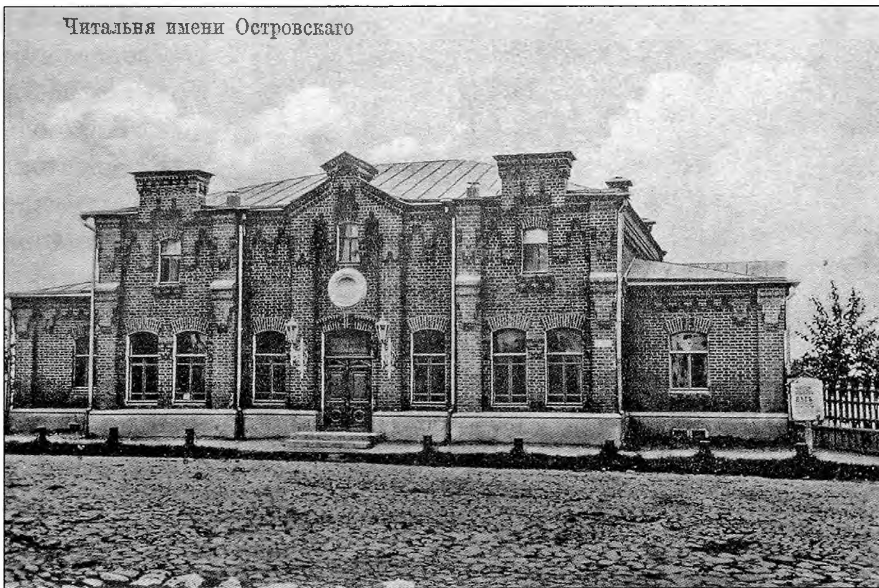
Кострома, народная библиотека-читальня имени А.Н. Островского. Фото с открытки начала XX века.

Е.М. Микифоров с супругой. Фото девяностых годов XIX века.