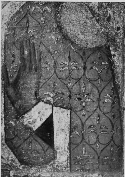
«Параскева Пятница». Оборот «Богоматери Федоровской», деталь живописи XIII в.

лист имеет сердцевидную форму), был распространён в искусстве Владимиро-Суздальской Руси. Близкой аналогией орнаменту костромской иконы служит орнамент на серебряной оправе так называемого шлема Ярослава Всеволодовича и рельефный орнамент, украшающий стволы колонок порталов и аркатурного фриза на северной стене Георгиевского собора в Юрьеве-Польском 18 .