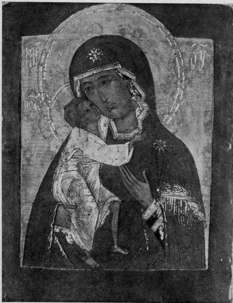
«Богоматерь Федоровская», XVI в. (После реставрации) Гос. Третьяковская галерея

Белые нимбы костремской иконы, некогда эффектно выделявшиеся на фоне серебра и хорошо очерчивающие силуэты голов, можно сопоставить с белыми нимбами иконы «Ярославской Оранты». Как известно, цветные нимбы были частым явлением в произведениях русской живописи домонгольского периода и только с XIV в. повсеместно получили широкое распространение золотые нимбы 20