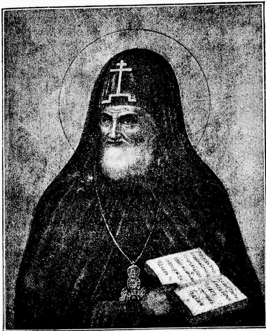
Святой Митрофанъ, 1-й епископъ Воронежскій.