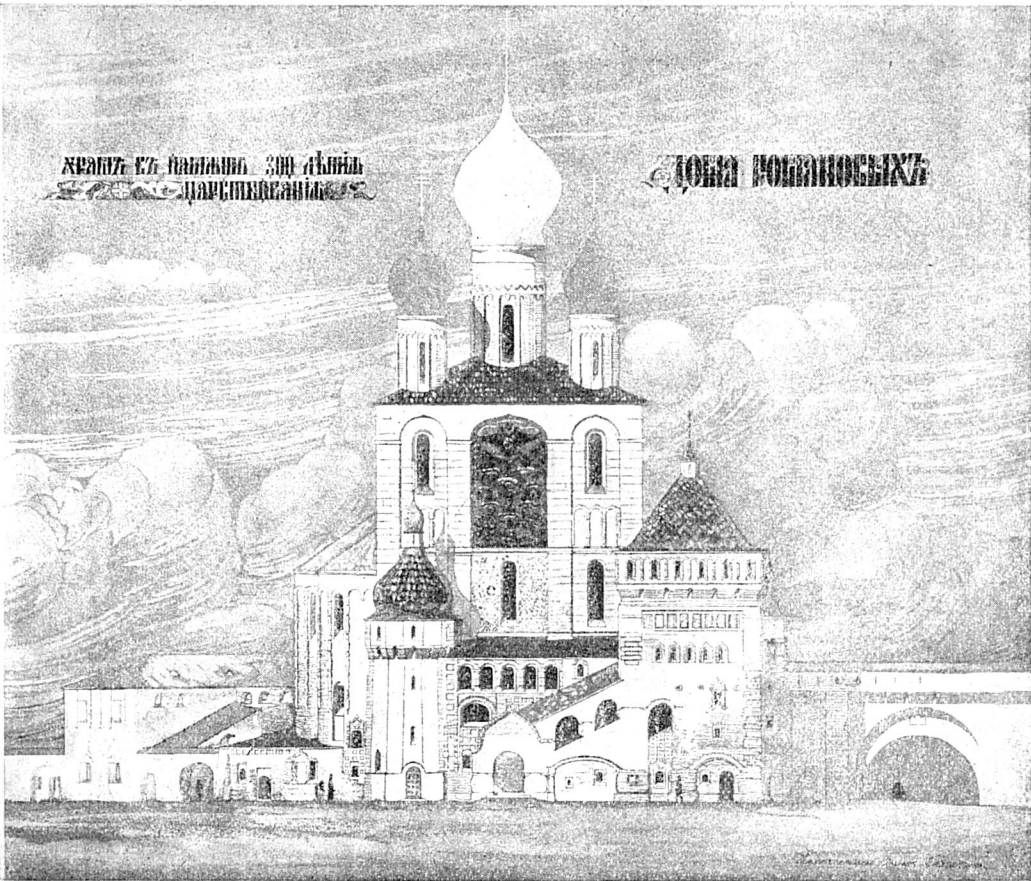
Храмъ въ память 300-лѣтія царствованія Дома Романовыхъ.

Въ память 300-лѣтія царствованія Дома Романовыхъ въ Москвѣ, въ Александровскомъ саду, въ зданіи бывшаго Императорскаго театра, въ 1913 году, архитекторомъ А. С. Шкловскимъ.