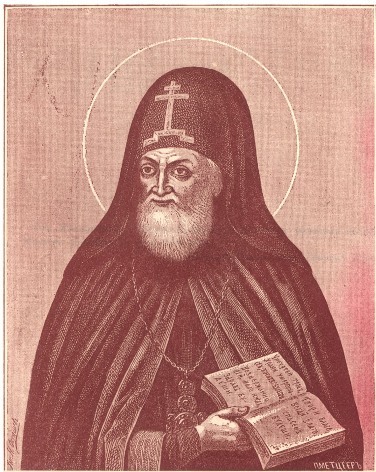
Святитель и чудотворецъ Митрофанъ, первый Епископъ Воронежскій.