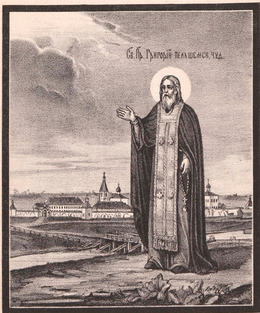
Литогр. А. Граншеля.