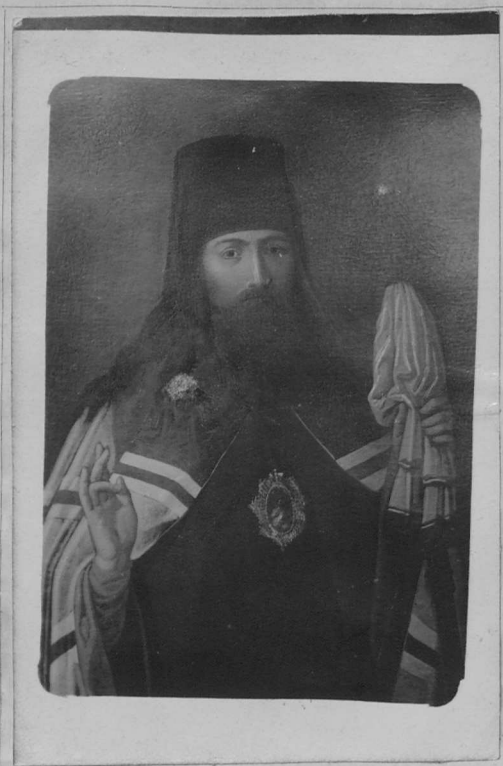
Епископъ Тихонъ III-й.