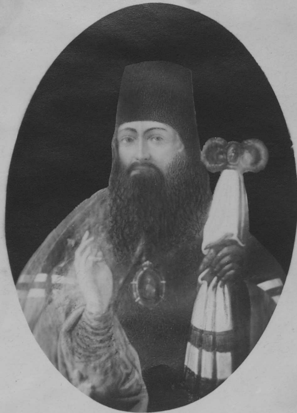
Святитель Тихонъ I-й.