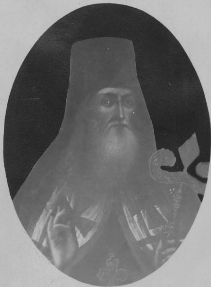
Архіеп. Арсеній І-й.