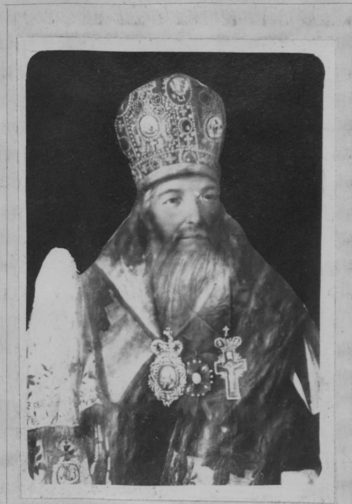
Епископъ Арсеній II-й.

17) Арсеній II-й, Епископъ , Москвинъ. Изъ архимандритовъ Колязина монастыря 1) хиротонисанъ въ санъ Епископа Старорусскаго 26 октября 1798 года. Въ слѣдующемъ году 1 октября назначенъ на Воронежскую кафедру: 11 октября въ томъ-же году переведенъ въ Пермь; 26 ноября того-же года снова получилъ назначеніе въ Воронежъ; скончался 6 мая 1810 года. Тѣло его поκειται въ Благовѣщенскомъ соборѣ Митрофанова монастыря. Воронежскою епархію управлялъ 10 лѣтъ и 6 мѣсяцевъ 2) . Составилъ руководство духовникамъ при исповѣди.