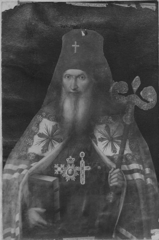
Архієписк. Антоній II-й.