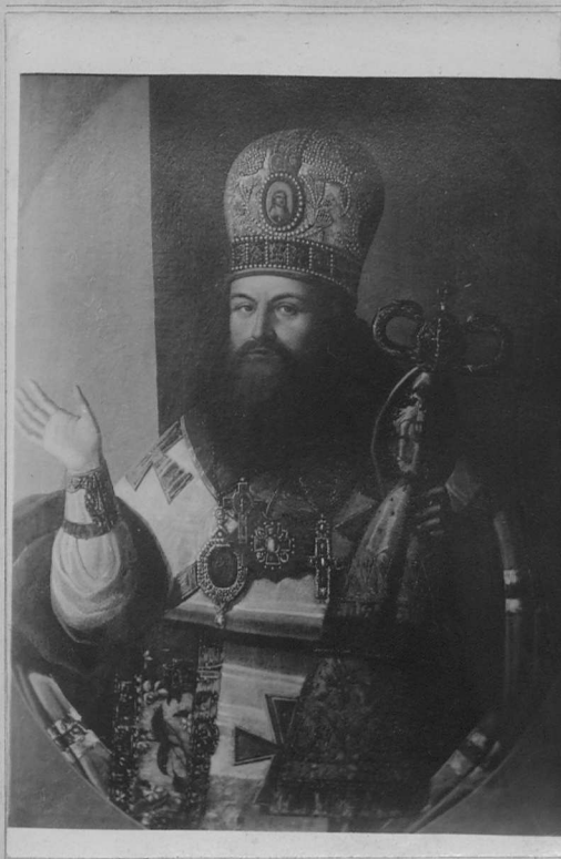
Епископъ Антоній I-й.

18) Антоній I-й, Епископъ , въ мѣрѣ Алексѣй Соколовъ, родился въ Казанской губ., сынъ священника. По окончаніи курса въ Казанской Д. Семинаріи былъ приходскимъ священникомъ, и затѣмъ возведенъ былъ въ санъ протоіерея. Овдовѣвъ, постригся въ монашество и поступилъ для дальнѣйшаго образованія въ Казанскую Д. Академію. 30 августа 1799 года былъ возведенъ въ санъ архимандрита Спасскаго монастыря Казанской епархіи и назначенъ ректоромъ Семинаріи. Въ 1805 г. былъ вызванъ на чреду въ С.-Петербургъ; 2 февраля 1808 года былъ хиротонисанъ во Епископа Старо-Русскаго, Викарія Новгородской Митрополіи. 23 сентября 1810 г. переведенъ въ Воронежъ; 7 февраля 1816 г. переведенъ въ Калугу; 15 марта 1819 г. переведенъ въ Каменецъ-Подольскъ съ возведеніемъ въ санъ Архіепископа; 3 апрѣля 1823 года по болѣзни 1) уволенъ на покой и по собственному желанію жилъ въ Задонскомъ монастырѣ, гдѣ и скончался 29 марта 1827 года. Воронежскою епархією управлялъ 6 лѣтъ и 7 мѣсяцевъ. Преосвященный Антоній оставилъ о себѣ память, какъ объ Архипастырѣ справедливомъ, но строгомъ и требовательномъ, а вмѣстѣ съ тѣмъ какъ о знатокѣ и любителѣ хороваго пѣнія 2) . Пребывая на покоѣ въ Задонскѣ, онъ много выстрадалъ по причинѣ своей болѣзни и велъ жизнь аскетическую. Въ Задонскѣ память его чтится, какъ угодника Божія. Тѣло его покоится въ усыпальницѣ Задонскаго монастыря подъ Вознесенскою трапезною церковію и пребываетъ (передаютъ иноки Задонскаго монастыря) нетлѣннымъ.