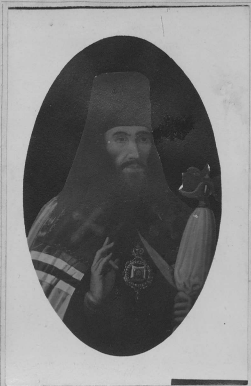
Епископъ Тихонъ II-й.