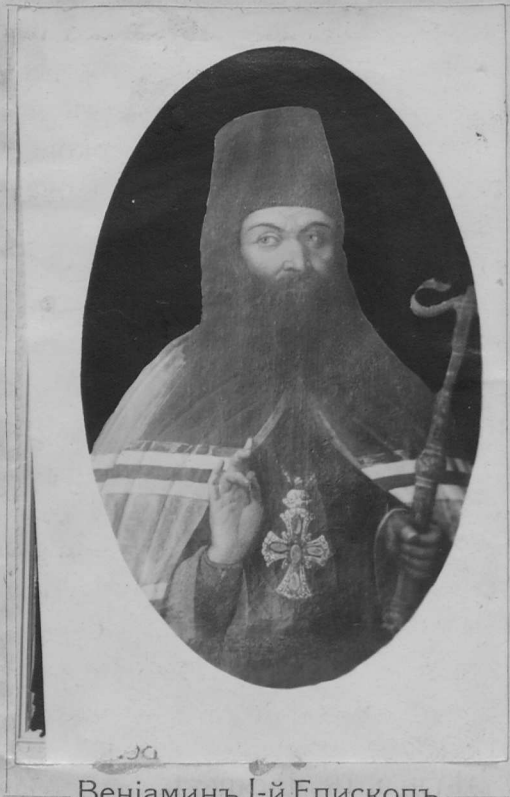
Веніаминъ I-й Епископъ.