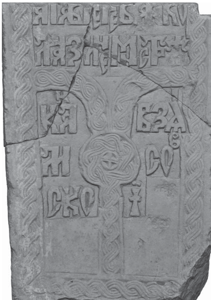
Рис. 3. Белокаменное надгробие с эпитафией Левкию. Верхняя грань. ККМ

Особенности структуры. В эпитафии присутствует указание на благоую кончину Левкия («преставился раб Божий»), но факт его насильственной смерти не отражен, хотя, что необычно для старорусских эпитафий, упоминается факт взятия Калязина монастыря Лисовским. Не упоминается иноческий сан Левкия.