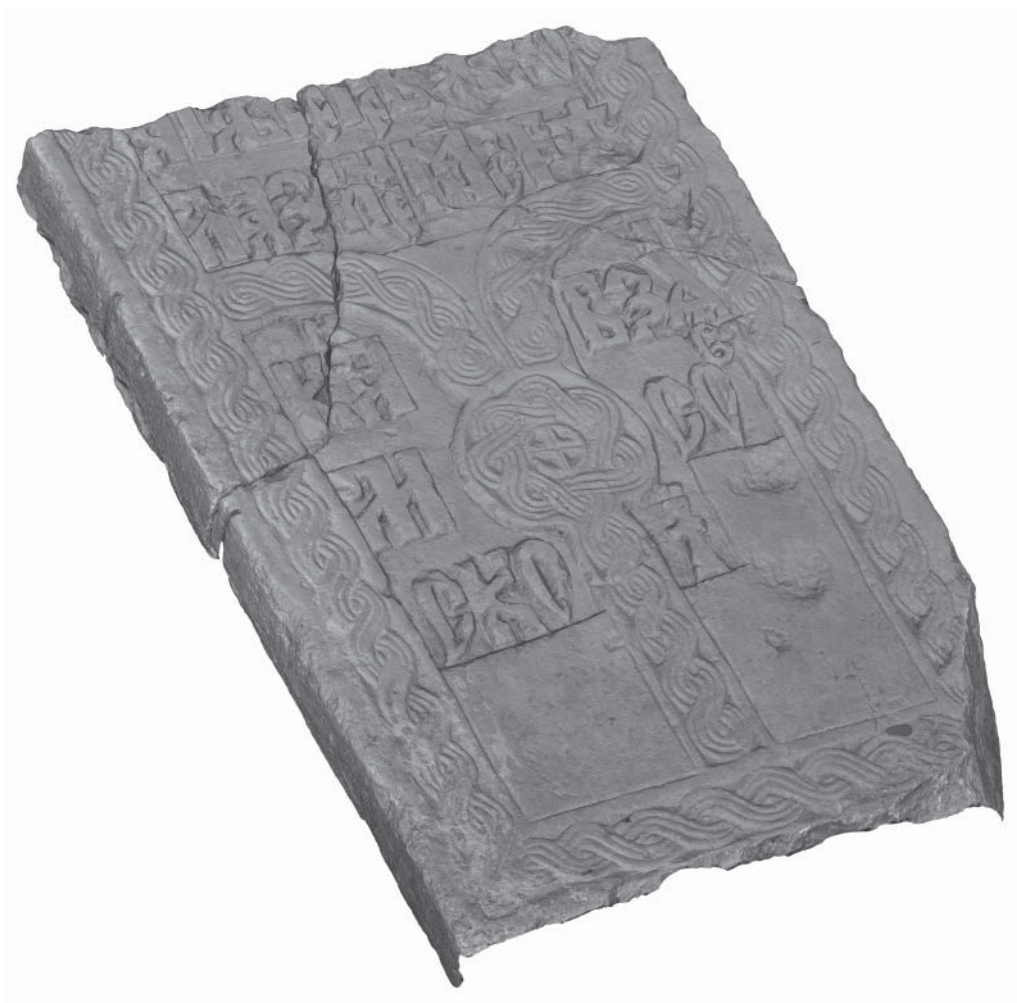
Рис. 2. Белокаменное надгробие с эпитафией Левкию. Общий вид. ККМ

Описание надписи. Эпиграфическое поле, занимающее верхнюю и нижнюю части плиты, разделено боковыми тягами. Надпись в 6 строк, из которых утрачена одна. Обронная резьба, выполненная путем выборки фона вокруг границ букв. Надпись выполнена по графье.