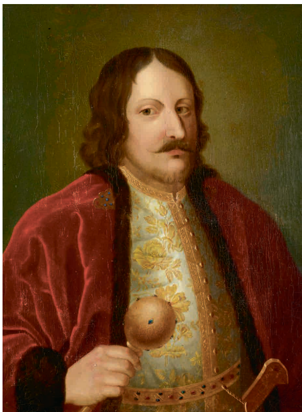
Фотография 1. Портрет князя Василия Васильевича Голицына.

Неизвестный художник. Государственный Эрмитаж, ГЭ-4645.