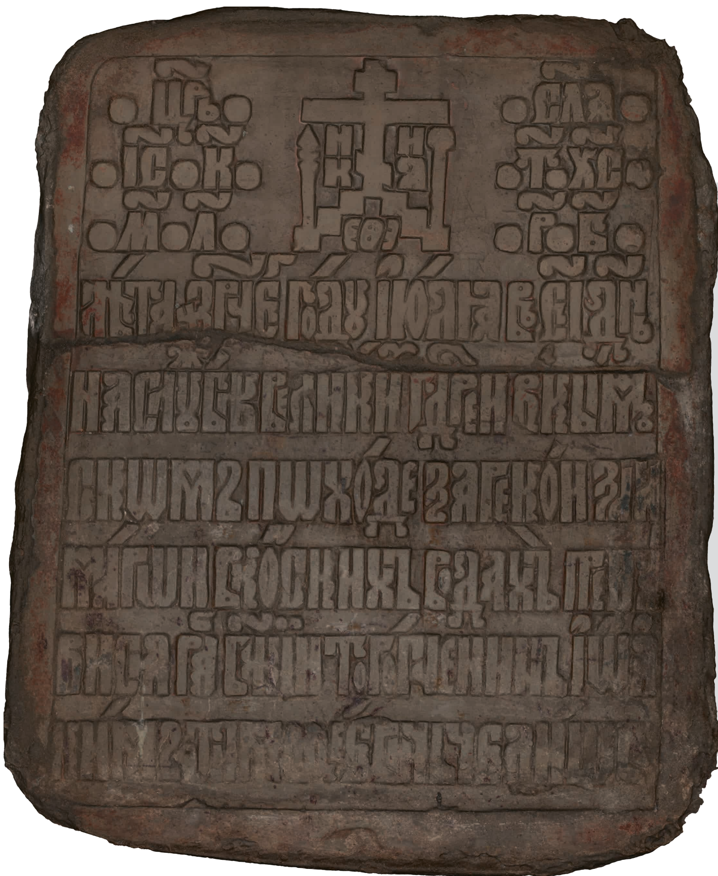
Фотография 3. Эпитафия Иоакиму Тимофеевичу Челищеву, торопчанину. (CIR0225)