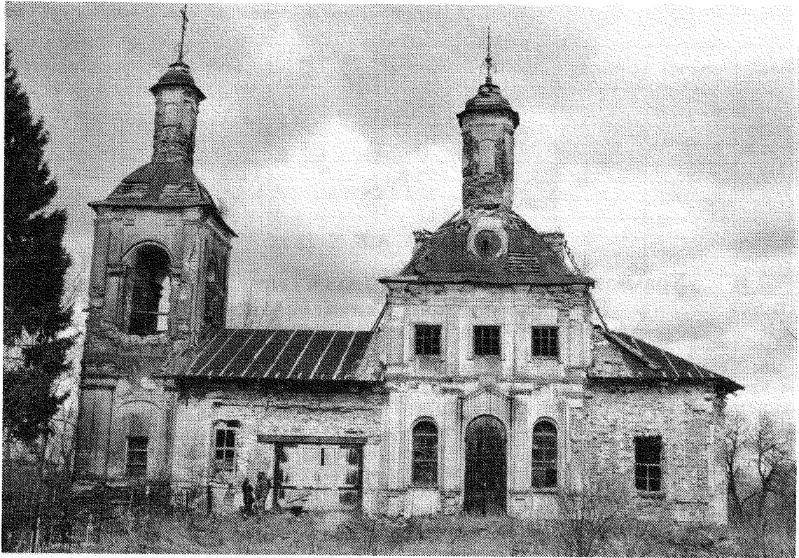
Рис. 1. Южный фасад Благовещенской церкви 1767 г. в селе Серединском. Апрель 2008 г.