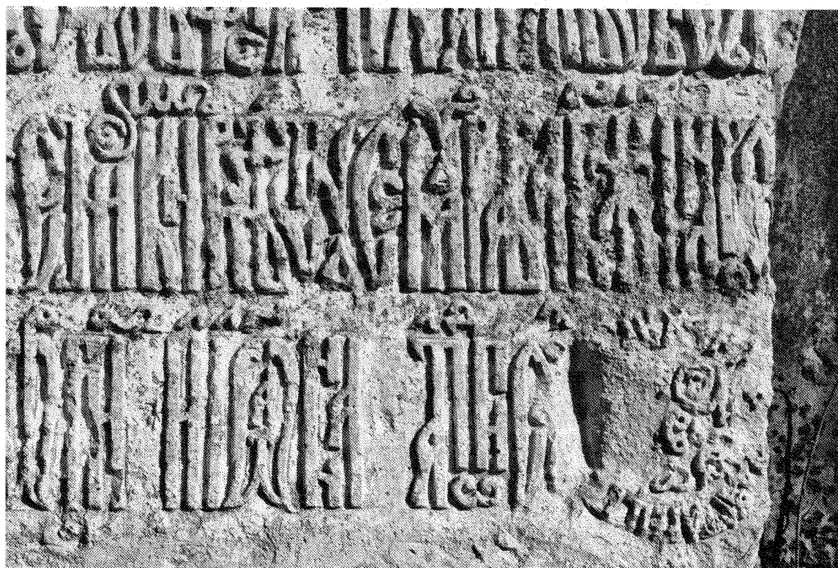
Рис. 5. Правая нижняя часть плиты с храмовой надписью. Апрель 2008 г.