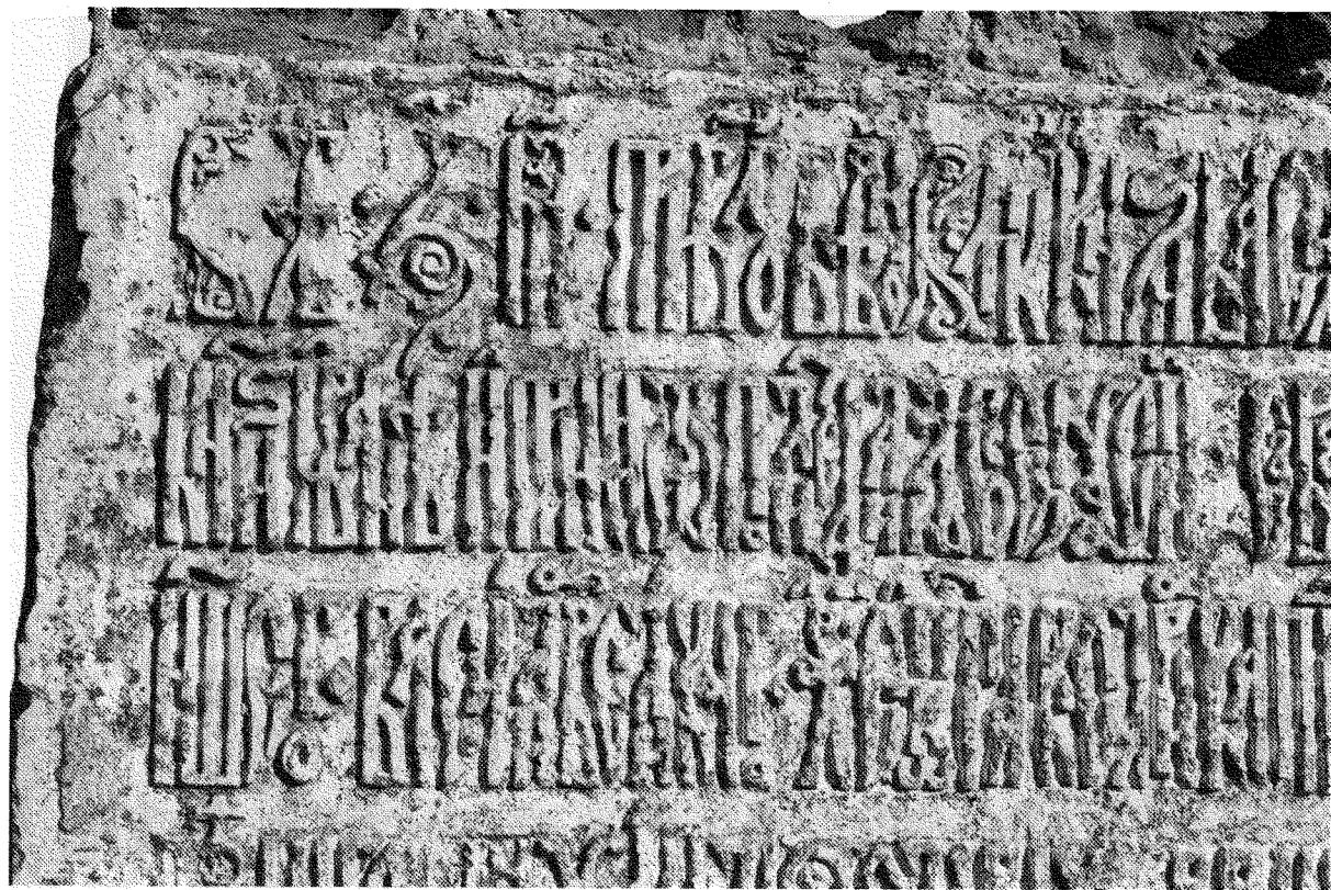
Рис. 4. Левая верхняя часть плиты с храмовой надписью. Апрель 2008 г.