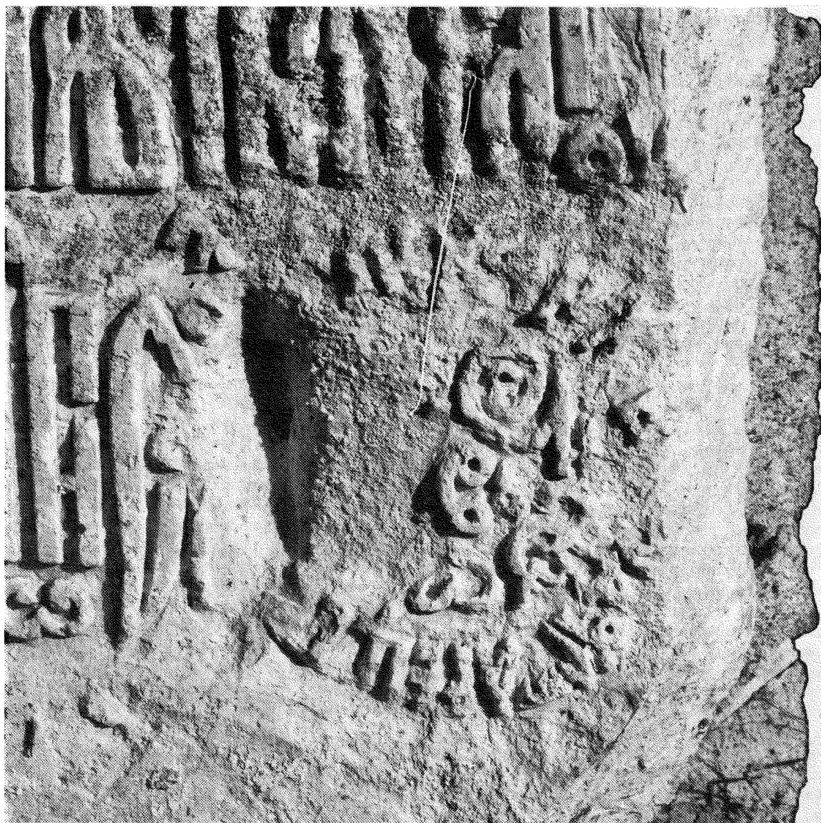
Рис. 6. Имя резчика, помещенное в круглом клейме в правом нижнем углу надписи. Апрель 2008 г.

находился на воеводских должностях, выполнял различные поручения великого князя Василия III (Зимин, 1988. С. 158–160). М.С. Воронцов получил боярство в 1514 г. (Веселовский, 1969. С. 224). В конце правления Василия III он – один из влиятельнейших людей в государстве (Веселовский, 1969. С. 224). В 1534–1535 гг. М.С. Воронцов – новгородский наместник и в этом качестве участвует в войне с Великим княжеством Литовским, а в 1536 г. выбывает из Боярской думы (ПСРЛ, Т. XXIX. С. 18, 133; Зимин, 1958. С. 52, 54; 1988. С. 159–160). По данным С.Б. Веселовского, он умер в 1539 г. (Веселовский, 1969. С. 224). Судя по всему, церковь в вотчинном селе Серединском была построена, когда М.С. Воронцов находился на вершине славы, и надпись, установленная на построенном им