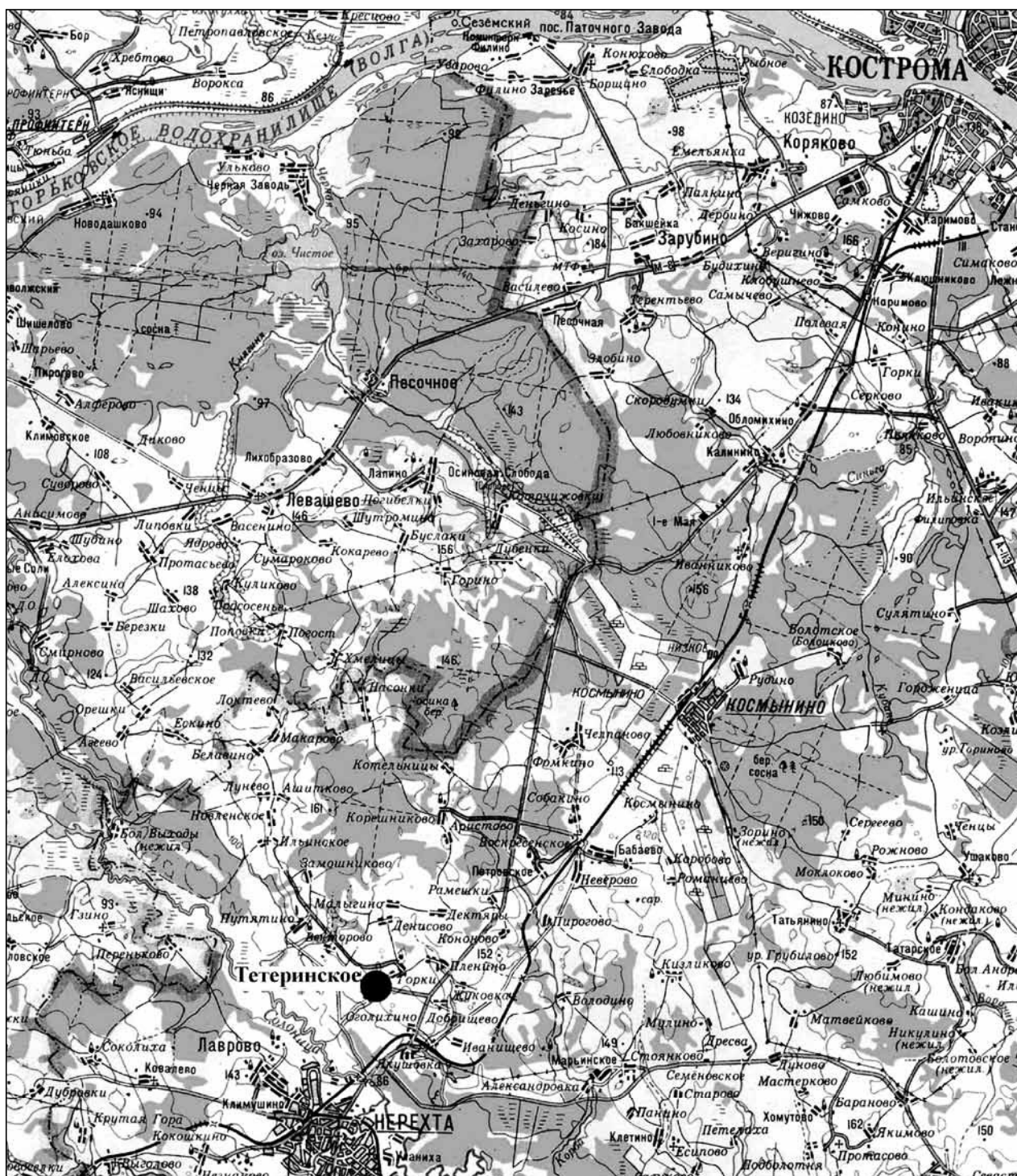
Рис. 1. Расположение села Тетеринское

в форме раскопок в центральной его части (Щербаков, 2014а). В целом исследования 2012–2014 гг. дали материалы, позволившие предварительно определить начальный этап жизни поселения в пределах второй половины XIII в., что соотносится с отмечавшимся исследователями оттоком населения из центральных районов Северо-Восточной