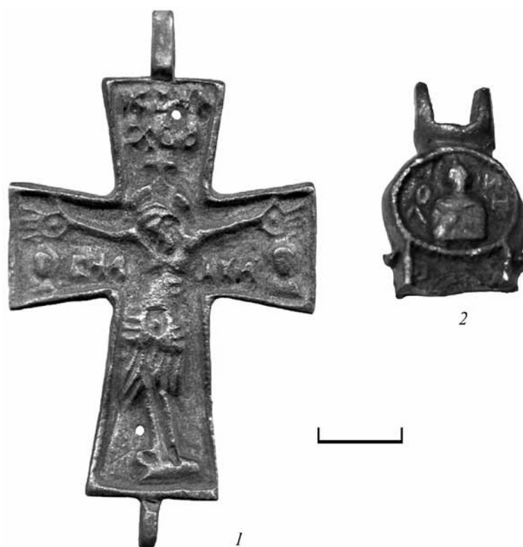
Рис. 4. Энколпионы из медного сплава, найденные на приусадебном участке вне предполагаемых границ распространения средневекового культурного слоя

Христос), СБ (сын божий), НИК (Ника). На оборотной створке в средокрестии – фигура св. Николая Чудотворца (?) в рост, в епископском облачении, с окладистой бородой и закрытым Евангелием на плече в руках (изображение полустерто). Надписи отсутствуют. На концах перекладины в круглых медальонах помещены поясные изображения ангелов (?) в виде человеческих фигур с крыльями за спиной и жезлами в руках. На нижнем и верхнем концах креста в круглых медальонах изображены херувимы (лики, обрамленные четырьмя крыльями) – обобщенный образ высших небесных сил.