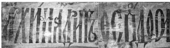
Ил. 2. Имя архимандрита Феодосии в надписи о строительстве храма Иоанна Богослова в Ипатьевской слободе. 1686 г. Фрагмент.

Наиболее близкой архитектурной аналогией Благовещенскому храму в селе Алферьево представляется церковь апостола Иоанна Богослова в Ипатьевской слободе (Ил. 1б), также построенная в стиле костромской архитектурной школы конца XVII в. Строительство последнего храма также связано с именем архимандрита Феодосия III. Церковь, как сообщает надпись на деревянной доске за иконостасом, начала строиться в 1679/80 г. «радѣніе і заводѣ бывшимъ архимандритѣ антоніе і слуга і служеника и словожаны і мысовыми і со всемъ прихоцкимъ людемъ», завершилось же строительство 11 декабря 1686 г. «тщание і радѣніе ипацкогѣ мнѣтра архимандритѣ феодосіе соверши[л] і освѣтилъ цркъ божію іоана бгслова» 1 (Ил. 2). Очевидно, наряду со слугами и служебниками Ипатьевского монастыря, жителями Ипатьевской слободы и Шунгенской волости («мысовыми») архимандрит Антоний выступил инициатором