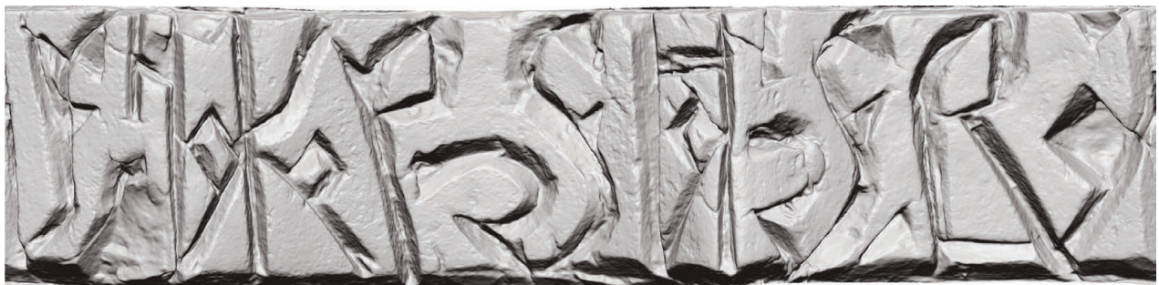
Рис. 8. Нож Б (РГМАА. № 0-3729). Развертка надписи у обушка. Рендер трехмерной полигональной модели с отключенной фотографической текстурой

отростками. Второе слово А. К. Станюкович угадал как имя отца в форме прилагательного притяжательного падежа – НВАНВ{А} . Оба слова отделены друг от друга вертикальной чертой-словоразделителем, и на 3D-модели хорошо видно, что для последней буквы в слове НВАНВ{А} резчик не рассчитал место и вырезал небольшую петлю на словоразделителе. Отметим следующие друг за другом две лигатуры – НВ и АН , а также переход О в А в первом заударном слоге, вполне допустимый в памятниках письменности XVI–XVII вв. (Тарабасова, 1986. С. 34). При этом начертание буквы А с горизонтальной верхней переключной, вертикальной правой мачтой, присоединенной к ее центру ромбовидной петлей, и наклонной левой мачтой абсолютно идентично начертанию этой буквы в надписи на ноже А. В надписи у обоймы-ограничителя (рис. 8) А. К. Станюкович верно прочитал контрактуру СНА с отсутствующим титлом. Следующее слово он определил как фамилию КОРСНА(Т?)ЄБА . Тем не менее 3D-модель надписи на нижнем регистре ножа дает бесспорный вариант чтения. По ней видно, что к нижней ноже буквы К присоединена буква А , вырезанная в виде ромба; нижние части букв С и Є украшены серповидными завитками, что дает чтение