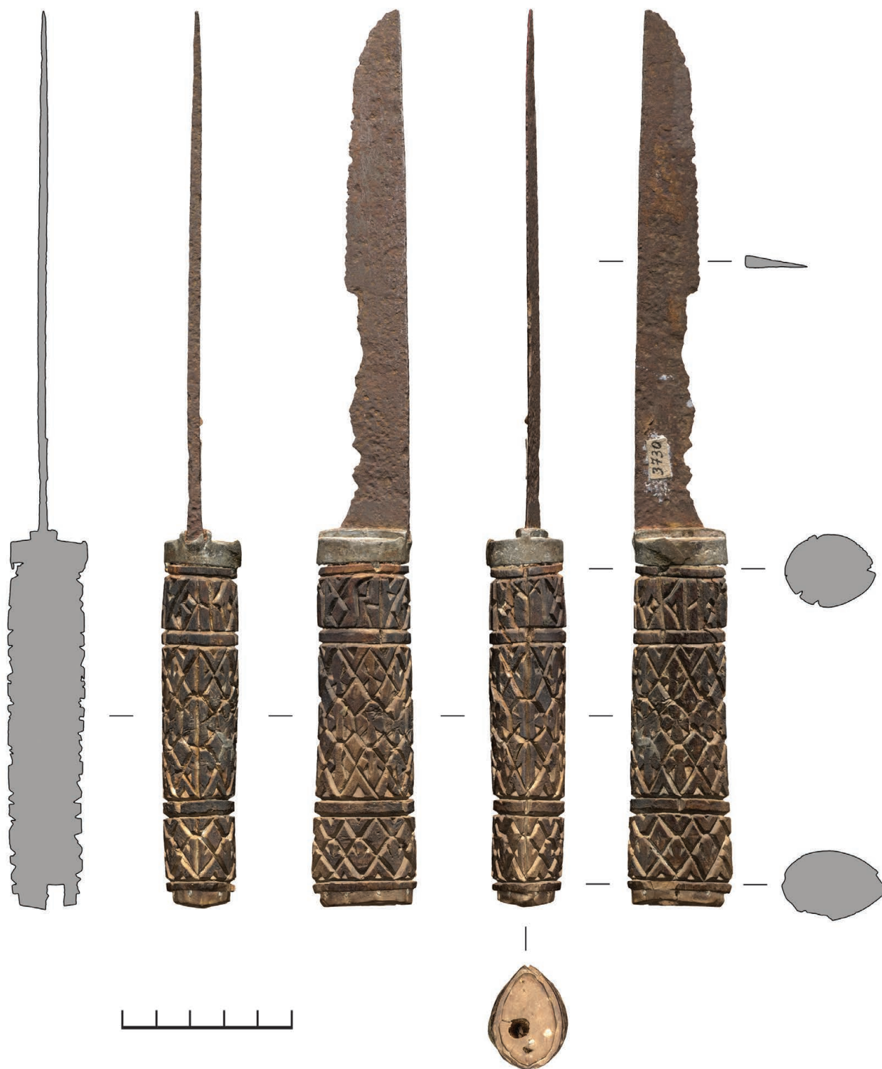
Рис. 2. Нож А (РГМАА. № 0-3730). Общий вид. Рендер трехмерной полигональной модели и сечения, построенные по модели