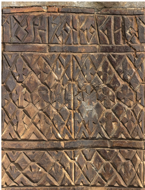
Рис. 4. Нож А (РГМАА. № 0-3730). Развертка поверхности рукояти. Рендер трехмерной полигональной модели