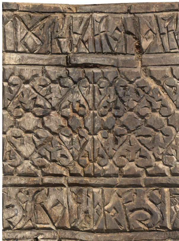
Рис. 5. Нож Б (РГМАА. № 0-3729). Развертка поверхности рукояти. Рендер трехмерной полигональной модели

Надпись на ноже А выполнена на пояске у обоймы-ограничителя, высота строки – 1,4 см. Надпись на ноже Б также вырезана на двух поясках у обоймы-ограничителя и у обушка рукояти; высота строки в обоих случаях – 1,6 см. Сверху и снизу эпиграфические поля ограничивают полосы, не заполненные орнаментом и отделяющие надпись от металлических деталей и орнаментированной части рукоятки. Надписи выполнены геометрической вязью без характерных для рукописного письма диакритических и надстрочных знаков и дробления мачтовых лигатур в технике асимметричной трехгранно-выемчатой резьбы с выборкой фона вокруг букв. По-видимому, резчик брал за образец надписи на изделиях из металла или, менее вероятно, ткани (Николаева, 1971. С. 64–65).