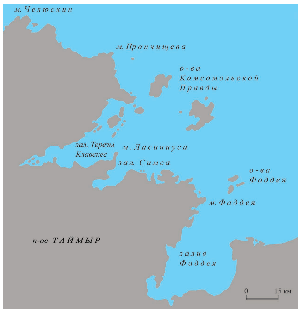
Рис. 1. Карта восточного побережья п-ова Таймыр

железного клинка (практически полностью сохранившегося у ножа А и обломанного у ножа Б) и деревянной рукояти, изготовленной из березового капа, опознаваемого по характерной свилеватости слоев древесины. Они относятся к большим ножам универсального назначения, обычным на русских памятниках позднего Средневековья и, в частности, в Западной Сибири – в Алазейском и Стадунском острогах и в Мангазее (Алексеев, 1996. С. 39, С. 113, Табл. 43; Белов, Освянников, Старков, 1981. С. 79–80, С. 140. Табл. 71, 1–9; Визгалов, Пархимович, 2007. С. 98, 99, 178, 179. Рис. 27, 28), но выделяются высоким качеством и продуманностью исполнения рукояти, имеющей анатомическую форму и обеспечивающей более удобный хват, чем традиционная прямая ручка овального сечения. Оба ножа несут следы многолетнего использования (сточенность лезвия, выкрошившаяся инкрустация, естественная заполированность ручки).