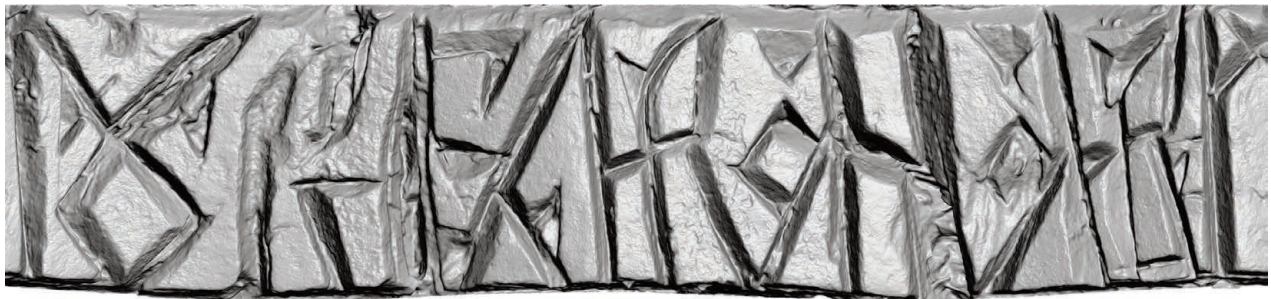
Рис. 7. Нож Б (РГМАА. № 0-3729). Развертка надписи у обоймы-ограничителя. Рендер трехмерной полигональной модели с отключенной фотографической текстурой