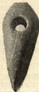
Каменный молоток (случайная находка).