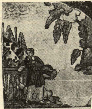
Изразец 18 века.

Историко-бытовой отдел. Со стен глядят портреты местных крупных и мелких дворянских фамилий: Вяземские,