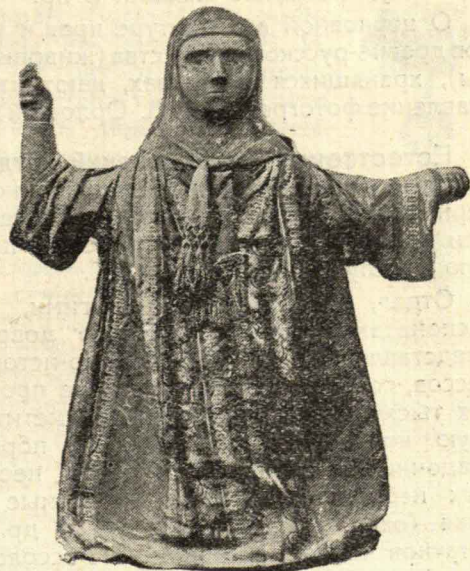
Параскева Пятница (из с. Туровского).

Когда-то страшилища и предметы религиозного поклонения, ныне статуи перенесены в музей. Почти все они грубой, но оригинальной работы неведомого резчика. Наиболее интересными являются: „Распятие Христа с предстоящими“ (из с. Палкина), „Христос в темнице“, (2—из Фролов