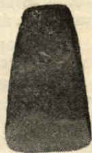
Каменное долото (стоянка «Пески»).

Интерес представляют выставленные в шкафу, вместе с перечисленным материалом, случайные археологические находки: