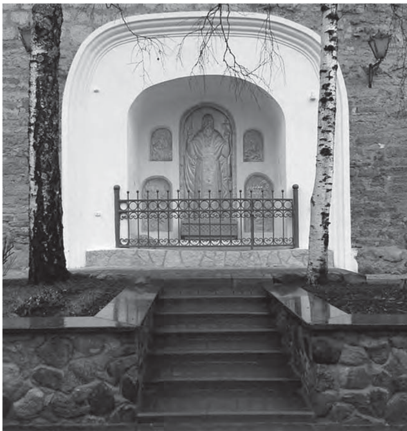
Ил. 2. Псково-Печерский монастырь. Памятный знак на «месте убийства» прп. Корнилия Печерского. Современное фото.