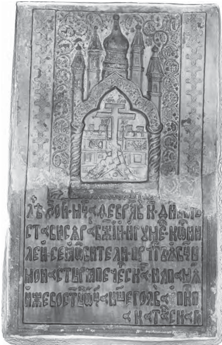
Ил. 1. Псково-Печерский монастырь. Надгробная керамическая плита-вставка с эпитафией прп. Корнилию Псково-Печерскому (С190410)