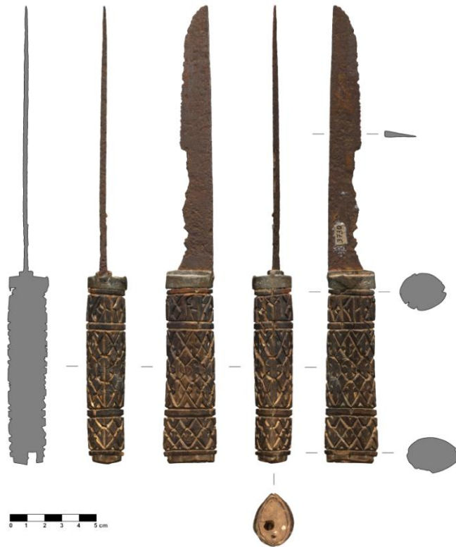
Рис. 2. Нож А (РГМАА, № 0-3729). Общий вид.

Рендер трехмерной полигональной модели и сечения, построенные по модели