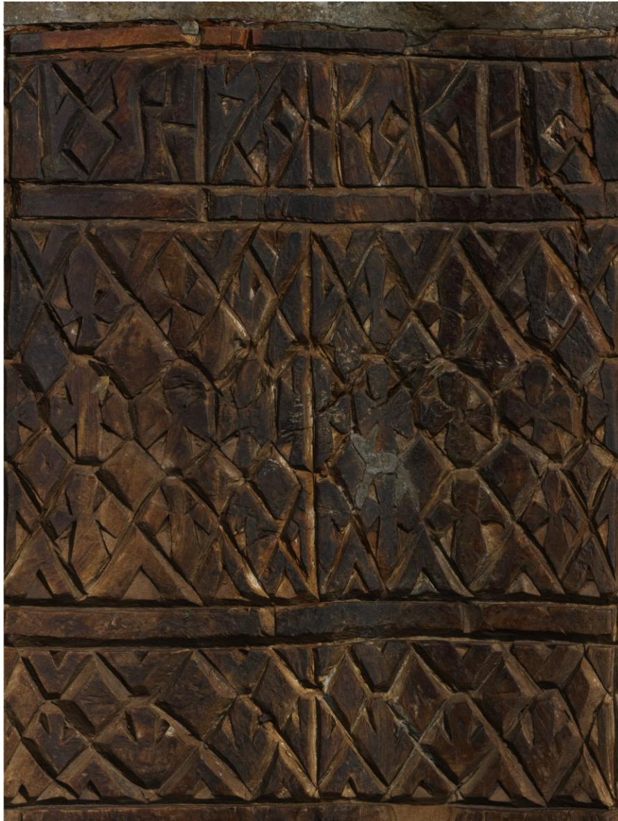
Рис. 4. Нож А (РГМАА, № 0-3729). Развертка поверхности рукояти. Рендер трехмерной полигональной модели Fig. 4. Knife A (RSMMAA, no. 0-3729). Plan of the surface of the handle. Render of 3D polygonal model

В зависимости от предпочтений авторов в научной, научно-популярной и краеведческой литературе владелец ножа А фигурирует как Акакий Мурманец [Кублицкий, 1957, с. 8–12; Белов, 1977, с. 17; Дервянко, 1986, с. 217; Булатов, 1998, с. 164; Стамборовский, 2014, с. 18], Акакий Мураг [Забелин, 1996, с. 183] или Акакий Муромец [Окладников, 1948, с. 15; Обручев, 1973, с. 42–43; Старков, 2008, с. 201; Чайковский, 2015, с. 92]. Под последним именем он вошел даже в предназначенные для школьников энциклопедии, посвященные освоению Арктики [Арктика..., 2001, с. 34]. В некоторых изданиях он иногда совершает плавание вместе с родным братом Иваном Муромцем, в соответствии с чтением фрагмента надписи на ноже Б [Магидович И., Магидович В., 1983, с. 267]. Пожалуй, сдержаннее других исследователей оказался В. Ю. Визе, связавший найденные предметы с неизвестными русскими мореплавателями, вынужденно зазимовавшими на о. Фаддея в 20-е гг. XVII в. [Визе, 1948, с. 9].