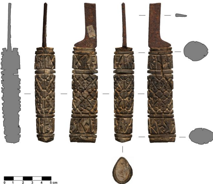
Рис. 3. Нож Б (РГМАА, № 0-3730). Общий вид.

Render of 3D polygonal model and the half of the knife made based on a model