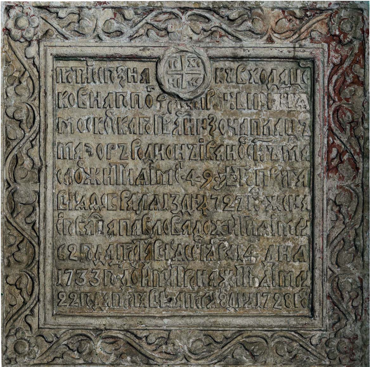
Поверхность модели с наложенной фотографической текстурой (схема Т)

ному читателю. Эпитафия сообщает только о возрасте и времени смерти членов одной дворянской семьи, жившей в Москве. Однако в задачи эпитафиста как раз и входит археология смыслов и представлений, которые «спрятаны» и в надписи, и за её пределами. И здесь важны изучение особенностей шрифта надписи, её декоративное оформление и восстановление биографий упомянутых в ней лиц.