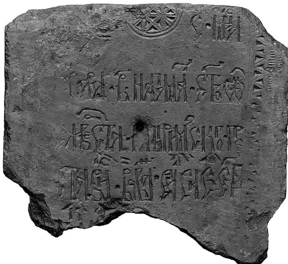
Рис. 3. СИР0686. Белокаменное надгробие 1497 г. Калязинский краеведческий музей им. И.Ф. Никольского. Инв. № КЗМ КП 1553. Верхняя грань. Современное состояние.