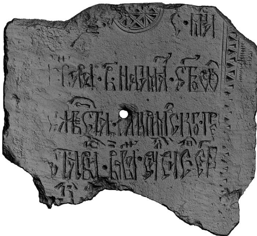
Рис. 4. CIR0686. Белокаменное надгробие 1497 г. Калязинский краеведческий музей им. И.Ф. Никольского. Инв. № КЗМ КП 1553. Верхняя грань. Улучшенное чтение надписи инструментами математической визуализации рельефа поверхности памятника относительно условной «нулевой» плоскости (схема G).

История памятника. Первоначально плита находилась на грунтовом некрополе Троицкого Калязина монастыря. Позднее была использована вторично в качестве гнезда под вертикальный запор полотна ворот. Найдена на территории монастыря в 1939 или 1940 г., вероятно, вместе с плитой CIR0689, использованной в качестве подпорки под вереву – вертикальный столб, на который навешивалось полотно ворот. После обнаружения передана в Калязинский краеведческий музей (ныне – Калязинский краеведческий музей им. И.Ф. Никольского).