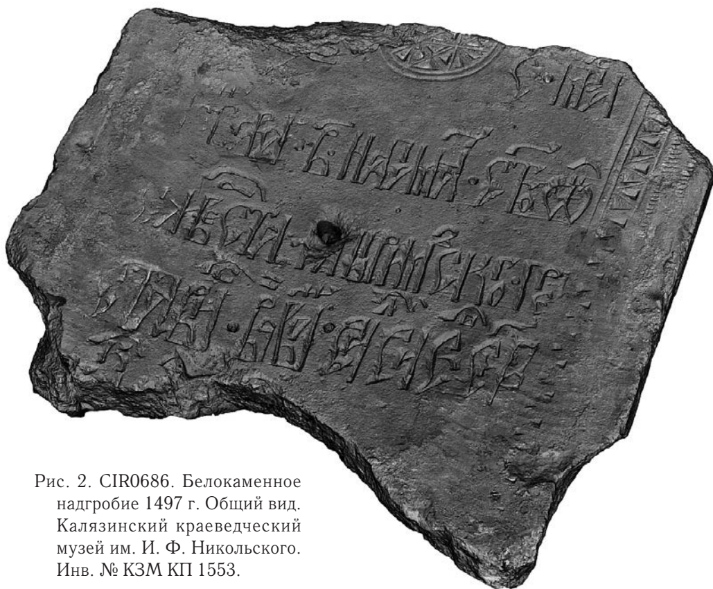
Рис. 2. СИР0686. Белокаменное надгробие 1497 г. Общий вид. Калязинский краеведческий музей им. И. Ф. Никольского. Инв. № КЗМ КП 1553.