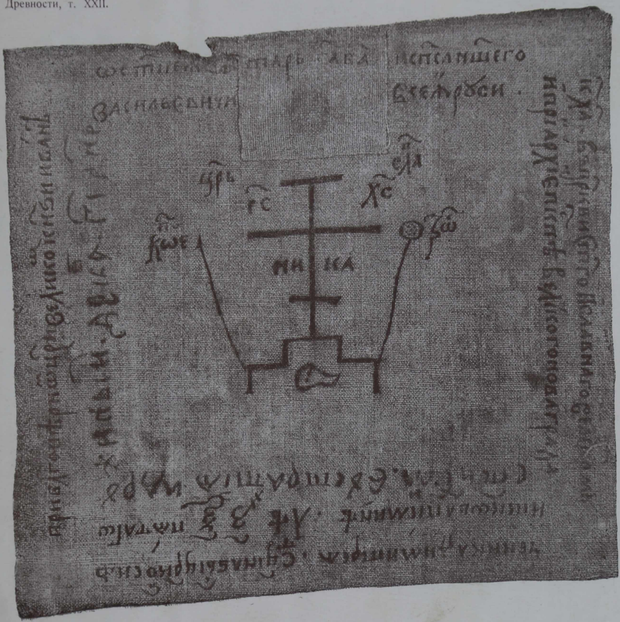
2. Антиминсь 1557 года.