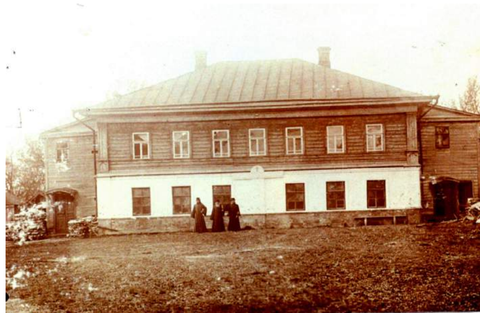
Дом соборного причта.

В храме имелось три престола: главный – в честь Преображения Господня, правый и левый – в честь Благовещения пресвятой Богородицы и в честь святого Преподобного Авраамия Чухломского Чудотворца. Служили в нем: два священника, два диакона и три псаломщика. В прошлом собор с юго-восточной и южной сторон, по земляному валу, был обнесен красивой каменной оградой с железной решеткой. С северо-восточной, северной и западной сторон находился городской сад. Сохранившиеся фотографии свидетельствуют о том.