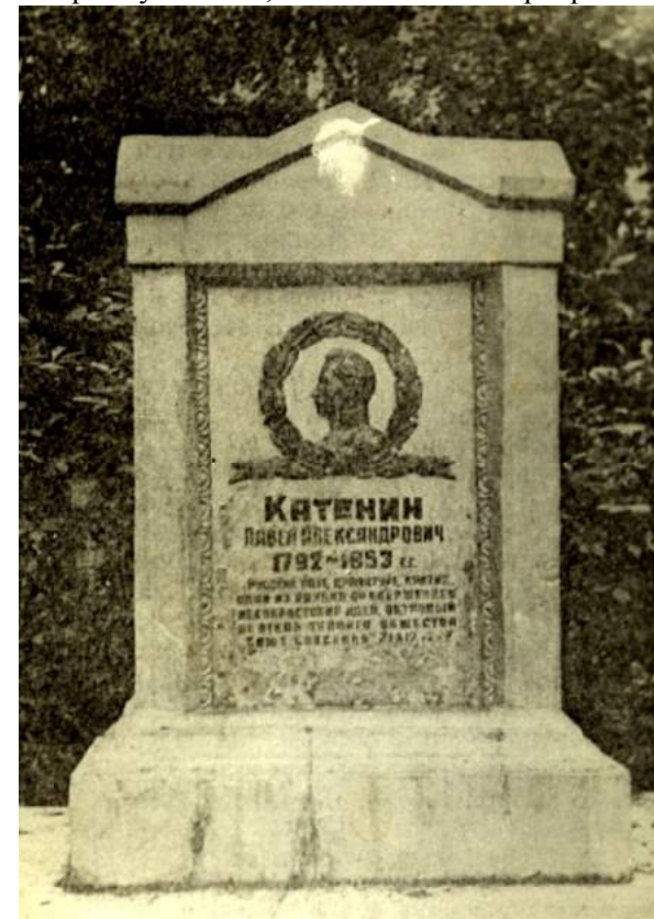
Памятник П.А. Катенину на кладбище.

Когда село Бореево перестало существовать, по инициативе Чухломского райисполкома прах П.А. Катенина в 1955 году был перенесен на городское кладбище в г. Чухлому. Над могилой соорудили небольшой надгробный памятник. Он представлял собой выполненный из кирпича и оштукатуренный прямоугольник, поставленный на ребро.