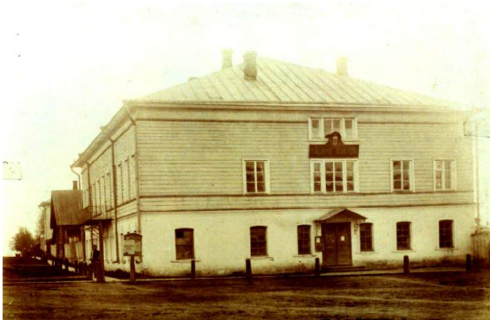
Земская управа. 1914 год.

500 рублей с тем, чтобы в течение года перевезти его в Чухлому. Собрание решило купить этот дом и использовать для верхнего этажа. Нижний каменный этаж решили строить на месте.