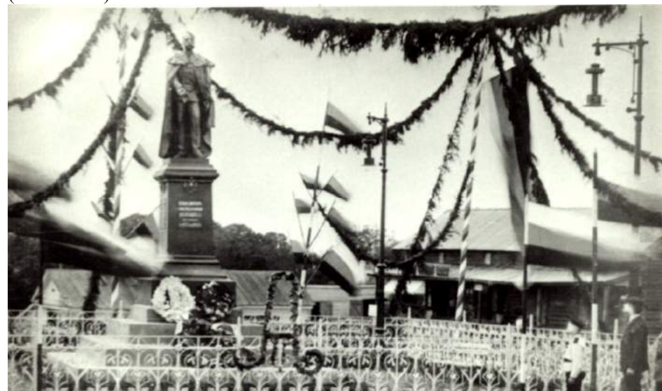
Памятник Александру II.

До Великой Октябрьской социалистической революции на месте захоронения находился памятник царю-освободителю Александру II. (1855-1881).