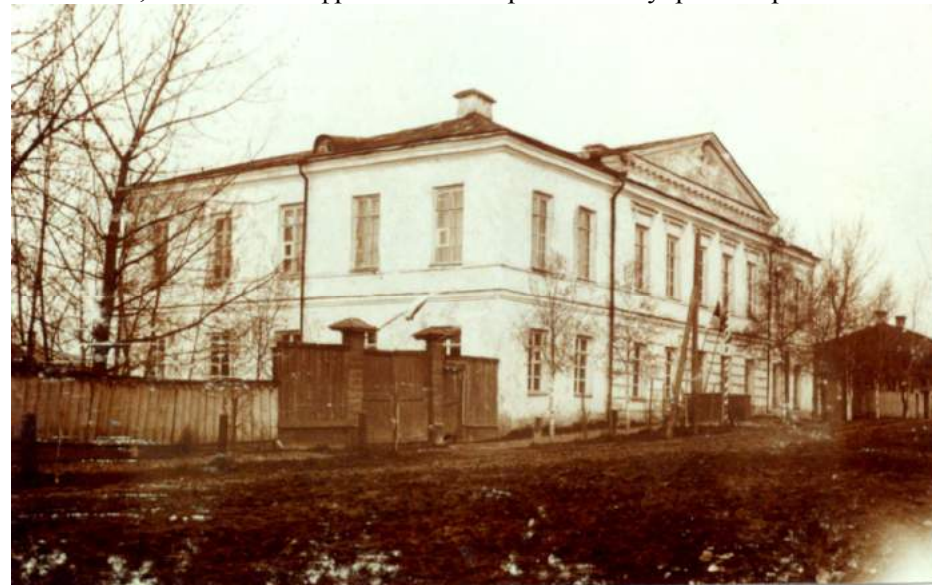
Здание присутственных мест.

Облик этого здания типичен для николаевской эпохи: суховатая сетка рустов в центре нижнего этажа, сандрики, гордо завершающие окна бельэтажа, неизменный фронтон с поперечным из увража карнизом.