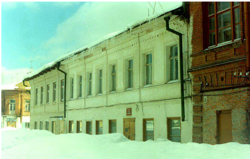
Дом Тагановых. Ул. Советская, 4.