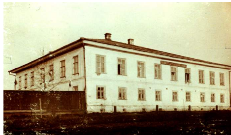
Бывшее городское семиклассное училище.

По улице Октября д.11 стояло двухэтажное здание, с 16 окнами на каждом этаже. Это было высшее городское семиклассное училище с коммерческим уклоном. Оно послужило основой и для гимназии, и для школы второй ступени. Директором высшего училища перед революцией был Рудилевский.