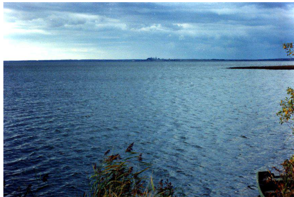
Чухломское озеро

Каждому из памятников посвящена небольшая аналитическая статья, включающая как сведения о самом памятнике, так и об исторических личностях, с ним связанных. Статьи в справочном пособии расположены в алфавите названий памятников. При иллюстрировании пособия использованы снимки, выполненные Д.П. Иудиным и С.И. Спиридоновым. Справочное пособие снабжено именованным указателем и списком памятников истории и культуры Чухломского района.