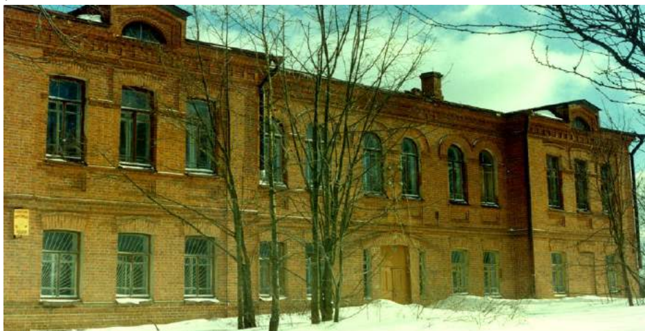
Бывшая Чухломская средняя школа.