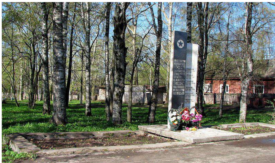
Памятник воинам истребительного батальона