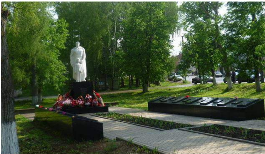
Памятник чухломичам, погибшим в боях (1941-1945)

На разных фронтах воевали чухломичи. Защищали Родину под Москвой и Ленинградом, сражались в районах Пскова и Новгорода, громили врага на Смоленщине, участвовали в Сталинградской, Курской и других битвах. Под Москвой погибло 46 чухломичей, под Сталинградом – 38, на Курской дуге – 86. Наибольшие потери понесли чухломичи в боях за Ленинград и Ленинградскую область, где был убит 381 человек.