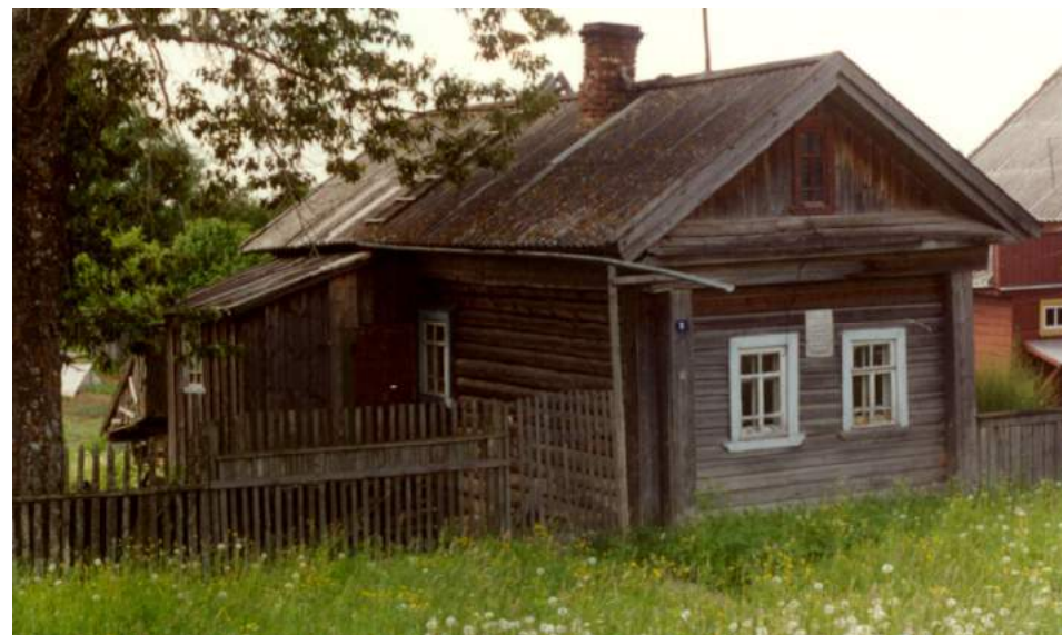
Дом № 9 по улице Яковлева