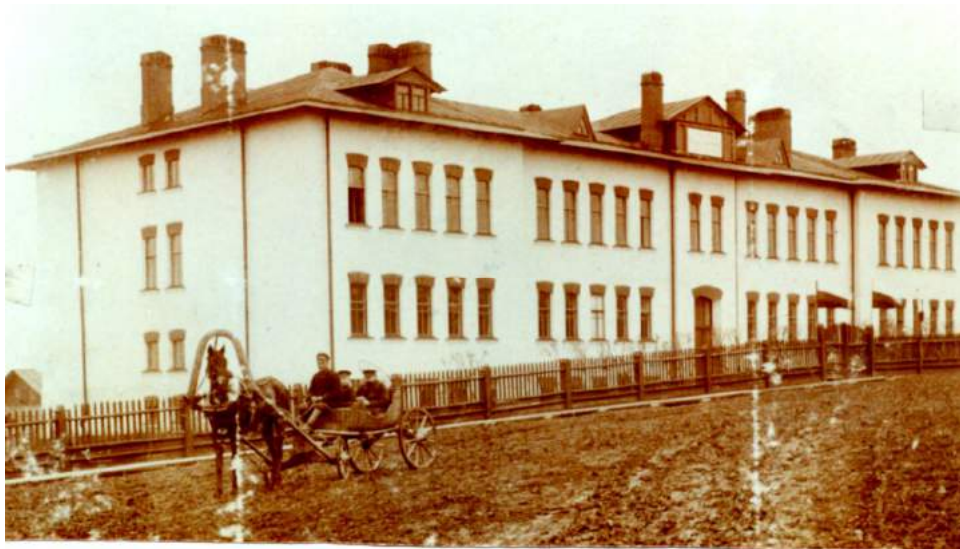
Детский приют братьев Парфеновых.