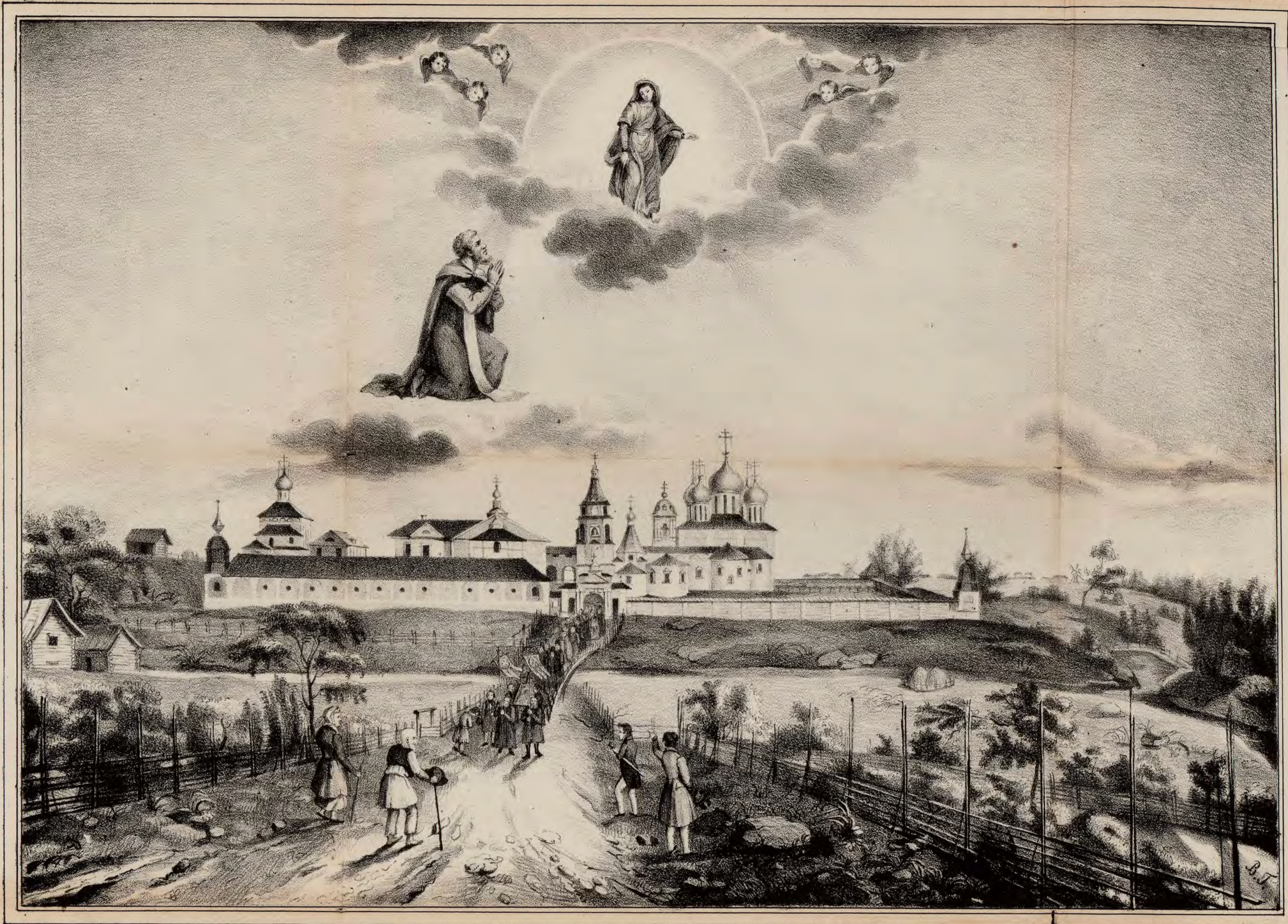
рис. в. А. Мухоморова.