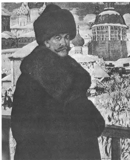
Ил. 2. Б.М. Кустодиев. Автопортрет. 1912 год. Галерея Уффици, Флоренция.

Нельзя не привести краткий словесный портрет исследователя, оставленный современником: «Среднего роста, черноволосый, носивший коротко подстриженные усы и бородку, всегда собранный, способный казаться хмурым из-за