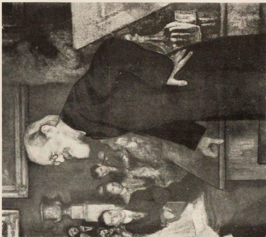
Лекція проф. В. О. Ключовскаго въ Училищѣ Живописи, Ваянія и Зодчества. (Съ картины Пастернака).