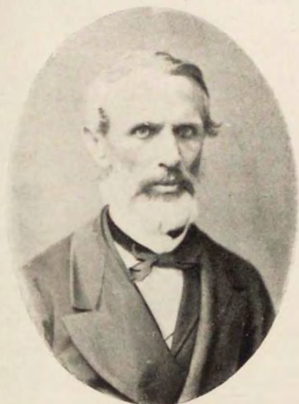
Проф. Петръ Симоновичъ Казанекій.