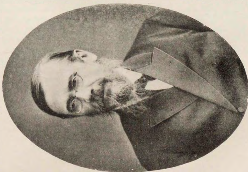
Проф. Василій Осиповичъ Ключевскій (въ 1855 г.).