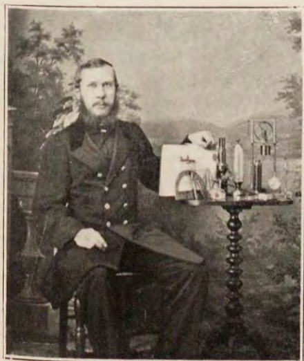
Проф. Дмитрій Феодоровичъ Голубинскій.