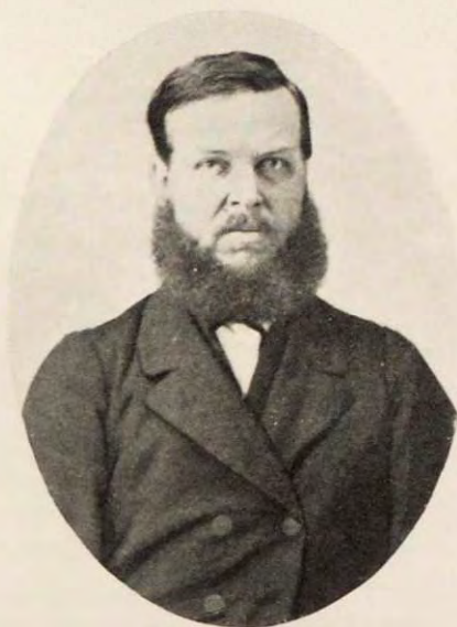
Проф. Александръ Феодоровичъ Лав- ровъ - Платоновъ, впоследствии архи- епископъ Алексѣй.