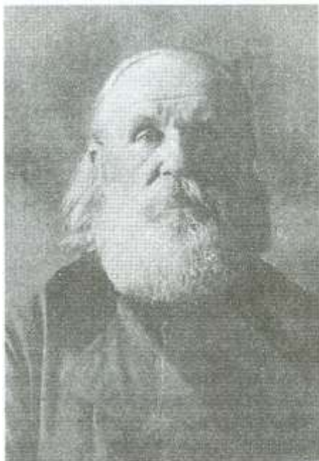
Протоиерей Димитрий Игнатенко. 1926 год.

забыли большевики и другой указ Высшего Церковного Управления на юго-востоке России — о необходимости пробуждения русского юношества и привлечения его к самовоспитанию и самодеятельности в духе религиознонравственного мировоззрения. Приведем отрывок из этого документа, во многом созвучного сегодняшнему дню.