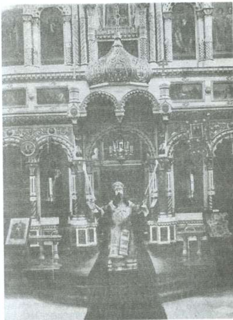
Епископ Евлогий (Георгиевский) в соборе

выборы. Предвидя давление со стороны правительства, епископ Никодим своевременно добился у Патриарха того, чтобы митрополит в данном случае был выбран большинством голосов, что оказалось решающим.