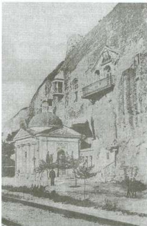
Инкерманский монастырь св. Климентя Римс

«Православный русский народ и Христолюбивое воинство!