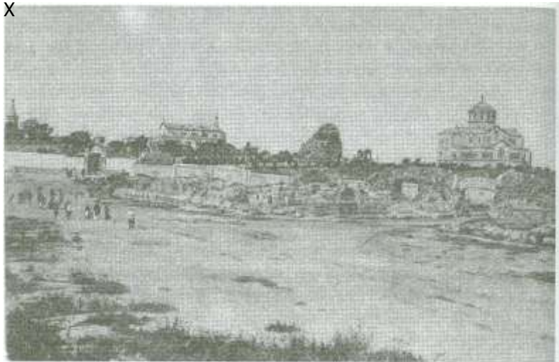
Херсонесский монастырь. Фото начала XX века