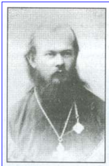
Протоиерей Александр Зверев. 1902 год 1

путаницы было необходимо дистанцироваться от самозванцев. Протоиерей Александр обладал всеми необходимыми качествами для нелегкого служения в сложившихся экстремальных условиях.