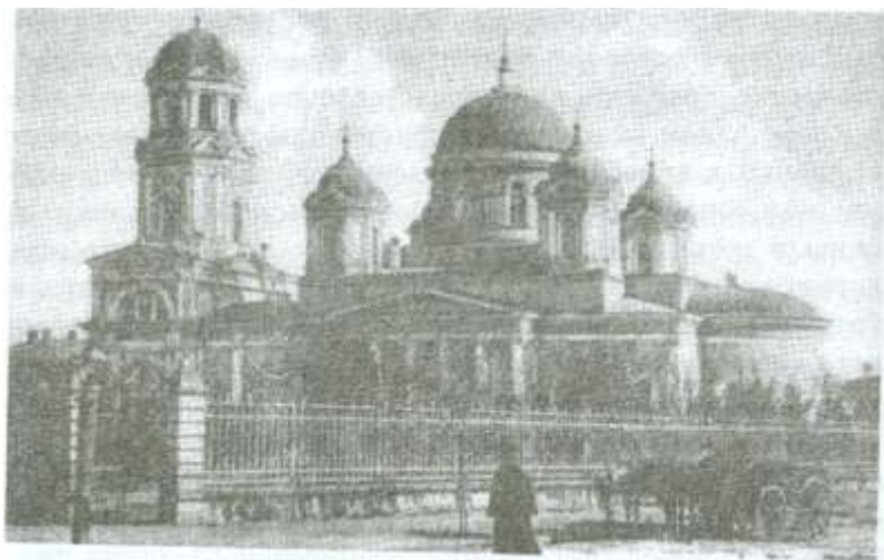
Симферополь. Александро-Невский кафедральный собор. Фото начала XX века

«если они предоставят доказательства своей непричастности к кражам, их все равно будут привлекать за небрежное хранение