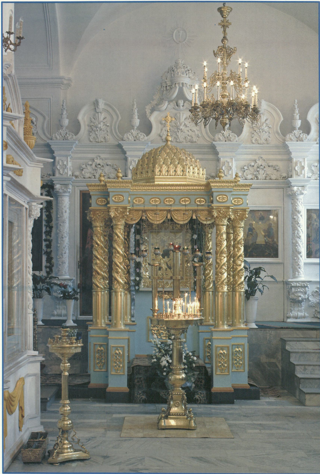
Киот с чудотворной Феодоровской иконой Божией Матери в Богоявленско-Анастасином кафедральном соборе града Костромы