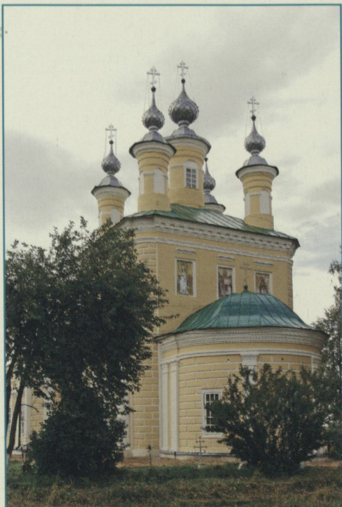
Никольский храм села Николо-Шанга.