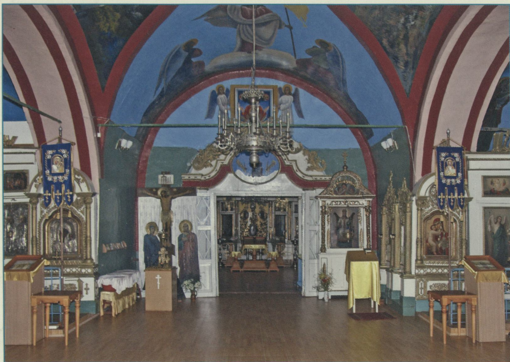
Внутренний вид Никольского храма.