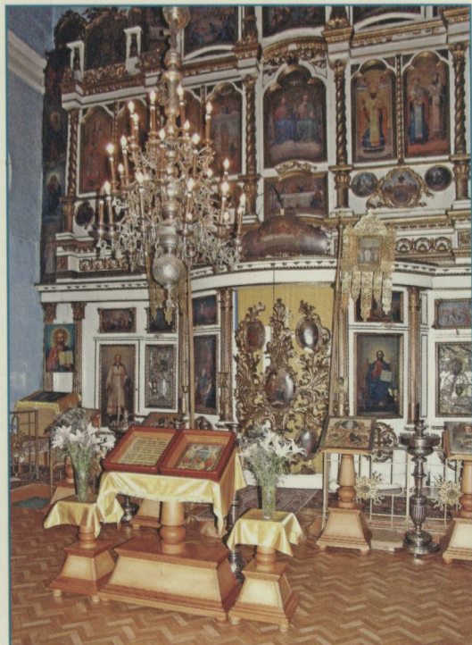
Иконостас Никольского храма.