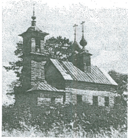
Рис. 1. Кашин. Церковь свв. Иоакима и Анны после перестройки 1830-х годов. Вид с юго-запада

Расположение города на торговой дороге, связывающей Русский Север с Москвой, давало несомненные преимущества для развития местной экономики и торговых связей. Поэтому развитие личного благочестия среди представителей кашинских посадских и купеческих семей имело под собой хорошую экономическую базу. В XIV–XVII веках это проявилось в активном строительстве приходских и монастырских храмов вдоль дороги, пересекающей город почти с севера на юг. Одним из таких храмов, расположенных в западной части Кашина, за впадающей в р. Кашинку небольшой речушкой Масляткой была церковь свв. Иоакима и Анны в Конюшенной слободе. Во время разорения города отрядами Лисовского в 1610 году храм, очевидно, был разрушен, так как Дозорная книга 1621 года упоминает здесь «место церковное, что был храм Иоакима и Анны». 1 Деревянная закладная доска, сохранявшаяся в церкви, свидетельствует, что церковь была вновь отстроена в дереве в 1646 году. 2