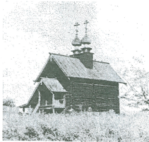
Рис. 2. Кашин. Церковь свв. Иоакима и Анны после реставрации 1970-х годов. Вид с юго-запада

Церковь простояла XVIII, XIX и XX века, оставаясь единственным сохранившимся деревянным храмом в Кашине, из некогда множества деревянных церквей города. В 1830-х годах он был перестроен в духе классицизма (рис. 1). Реставрация 1968–1971 годов вернула ему первоначальный вид храма клетского типа под высокой двускатной кровлей с парными луковичными главками (рис. 2–3). К сожалению, в 1995 году храм сгорел. На его месте на момент последнего осмотра в июне 2012 года сохранялись ещё часть нижних венцов и остатки фундамента (рис. 4).