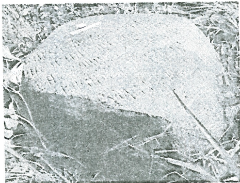
Рис. 7. Кашин. Валунное надгробие 1594 года. Вид с юго-запада.