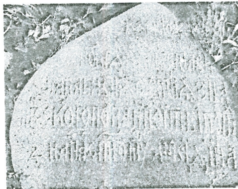
Рис. 8. Кашин. Валунное надгробие 1594 года. Эпитафия.

Ввиду отсутствия археологических раскопок у данного объекта вопрос о принадлежности надгробия к некрополю последнего храма решается неоднозначно. Есть основания предполагать, что надгробие находится in situ . Об этом свидетельствует не только его расположение по линии восток-запад, но и привязка к