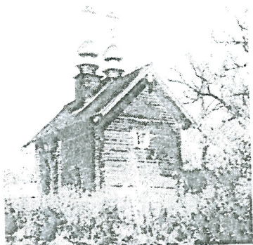
Рис. 3. Кашин. Церковь свв. Иоакима и Анны после реставрации 1970-х годов. Вид с северо-востока

У южной стороны храма находится валун шокшинского песчаника овальной формы (твёрдость 5 по шкале Мооса) 3 с вырезанной в верхней части эпитафией. Расстояние верхней части плиты от южной стены храма ок. 2,3 м, нижней — ок. 2,35 м. Географические координаты валуна, вычисленные с помощью навигатора JPRS: 57° 21' 49,61" северной широты, 37° 36' 15,69" восточной долготы. Надпись на плите ориентирована по линии восток-запад, отклонение от севера 0,5–0,7, что, видимо, свидетельствует о том, что валун находится над могилой in situ .