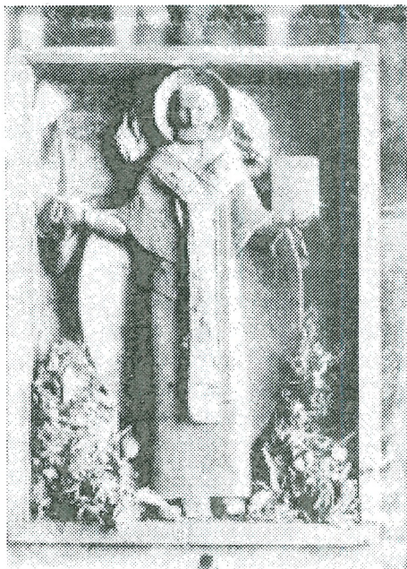
Фото 1. Скульптура «Святитель Николай Мирликийский (Можайский)» из церкви Николая на Острове Чухломского уезда

Указанный памятник не сохранился, однако нам удалось разыскать дореволюционную фотографию этой скульптуры. Снимок находится в московском частном собрании. На обороте есть