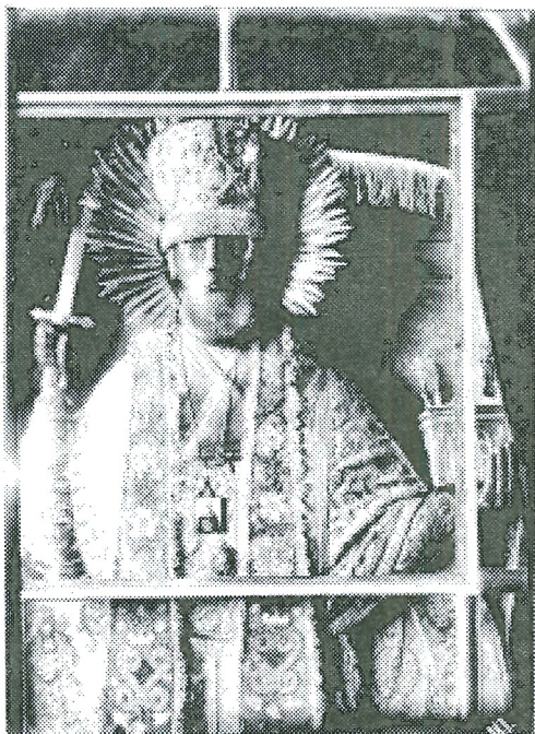
Фото 2. Скульптура «Святитель Николай Мирликийский (Можайский)» из Николаевской церкви г. Солигалича в металлической и шитой ризе

В уже упомянутом альбоме С.А. Орлова имеется фотография деревянной скульптуры св. Николая Можайского из Николаевской церкви на Наволоке Солигаличского уезда (в настоящее время скульптура находится в фондах Костромского музея-заповедника, КП 2047). Святой облачен в чеканную металлическую фелюну с ра-