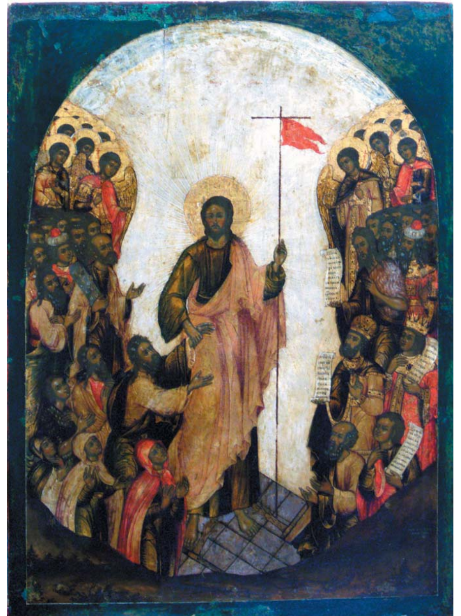
Ил. 5. Корнилий Уланов. Воскресение (Сошествие во ад). 1718. Иконостас Рождественской церкви в Нижнем Новгороде