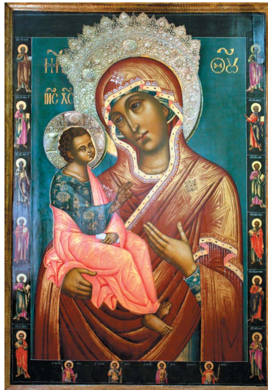
Ил. 1. Иван Уланов. Богоматерь Иерусалимская. 1706 г. Из Феодоровского монастыря в Переславле-Залесском. ПЗИАХМЗ