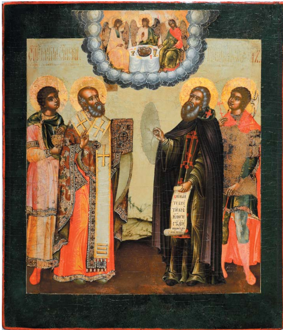
Ил. 4. Корнилий Уланов. Избранные святые в молитве Святой Троице. 1716. Частное собрание. Фото иконы без оклада