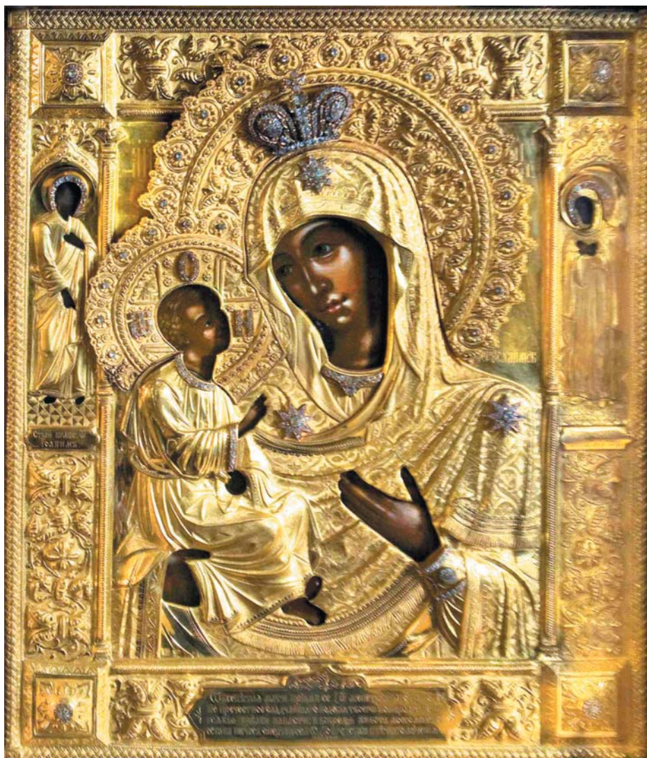
Ил. 2. Богоматерь Иерусалимская. Пантелеимонов монастырь на Афоне