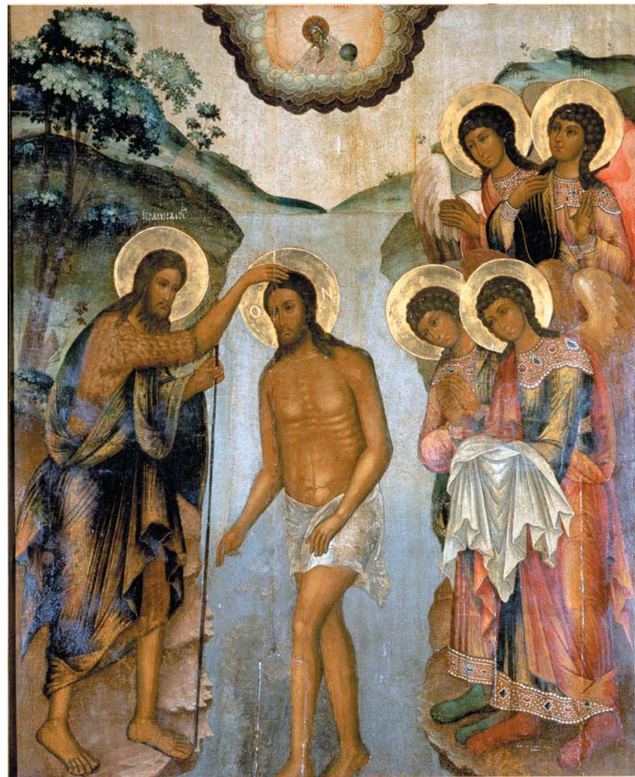
Ил. 9. Корнилий Уланов. Крещение. 1727. Из Богоявленской церкви в Юрьевце. Собор Богоявленского монастыря в Костроме