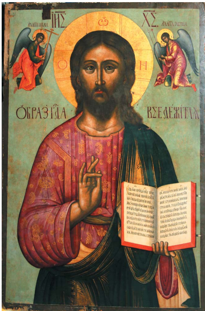
Ил. 10. Корнилий Уланов. Господь Вседержитель. 1728. Из Сретенской церкви в Юрьевце. ГРМ