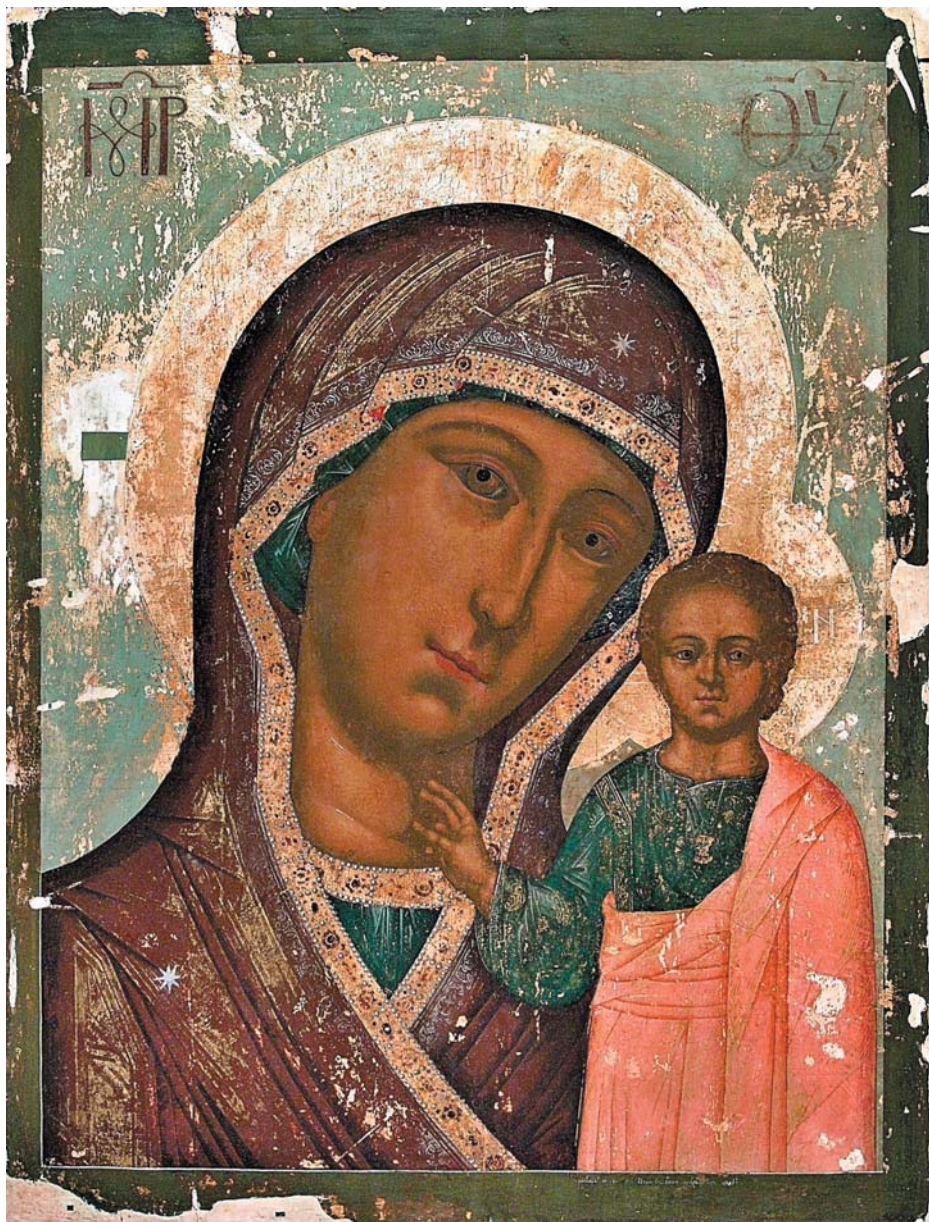
Ил. 8. Корнилий Уланов. Богоматерь Казанская. 1720-е гг. Частное собрание