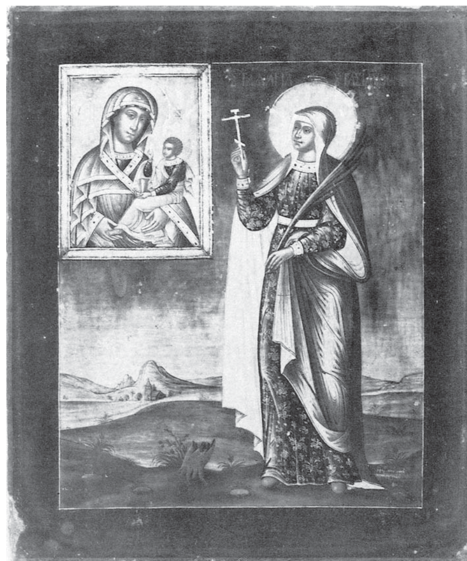
Ил. 7. Анастасия Узорешительница, в молении иконе Богоматери Шуйской-Смоленской. 1724. ГРМ