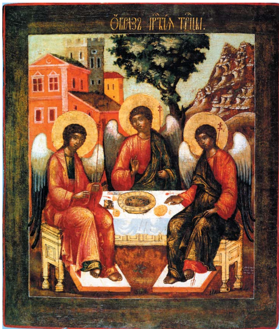
Ил. 6. Корнилий Уланов. Святая Троица. 1721. Иконное собрание Фонда Андрея Первозванного