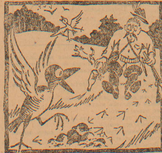
Но вот и „зверь“, он „дик и зол“, Трезорка в лес умчался в страхе. Охотник крепче стиснул ствол Мороз струится под рубахой.