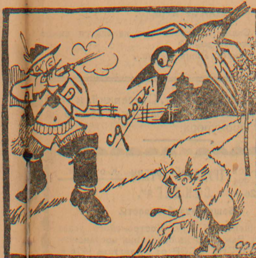
Рука охотника как сталь И шлет он новый залп по зверю И страшный зверь убитым пал, С кровью горячей землю.