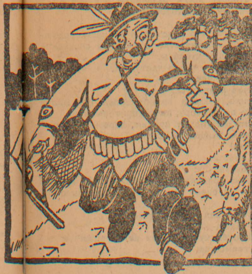
Обидит след... Трезорка встал. Кричит охотник: Куш! Не трогай! Крюк на взвод. Медведь пропал, Прощайся зверь с родной берлогой!