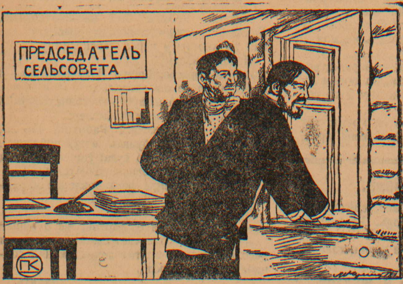
Рисунок М. Черемных.

Содержание приезжающих в сельсоветы инструкторов часто производится за счет местного бюджета, что ложится тяжелым бременем на сельсовет.