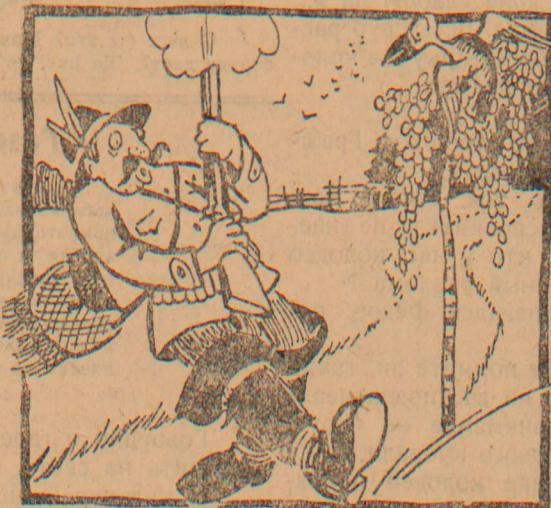
Охотник метко видит цель. Раздался выстрел, пуля мимо. Еще бы миг и прыгнул зверь— Но пробил час неотвратимый