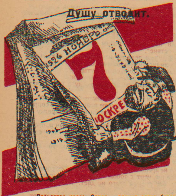
Пронлятое число. Сорву — все же легче будет.

обложке. Да куда же оно запропастилось? Наверно, в столе. Нет и тут. Панкратыч!