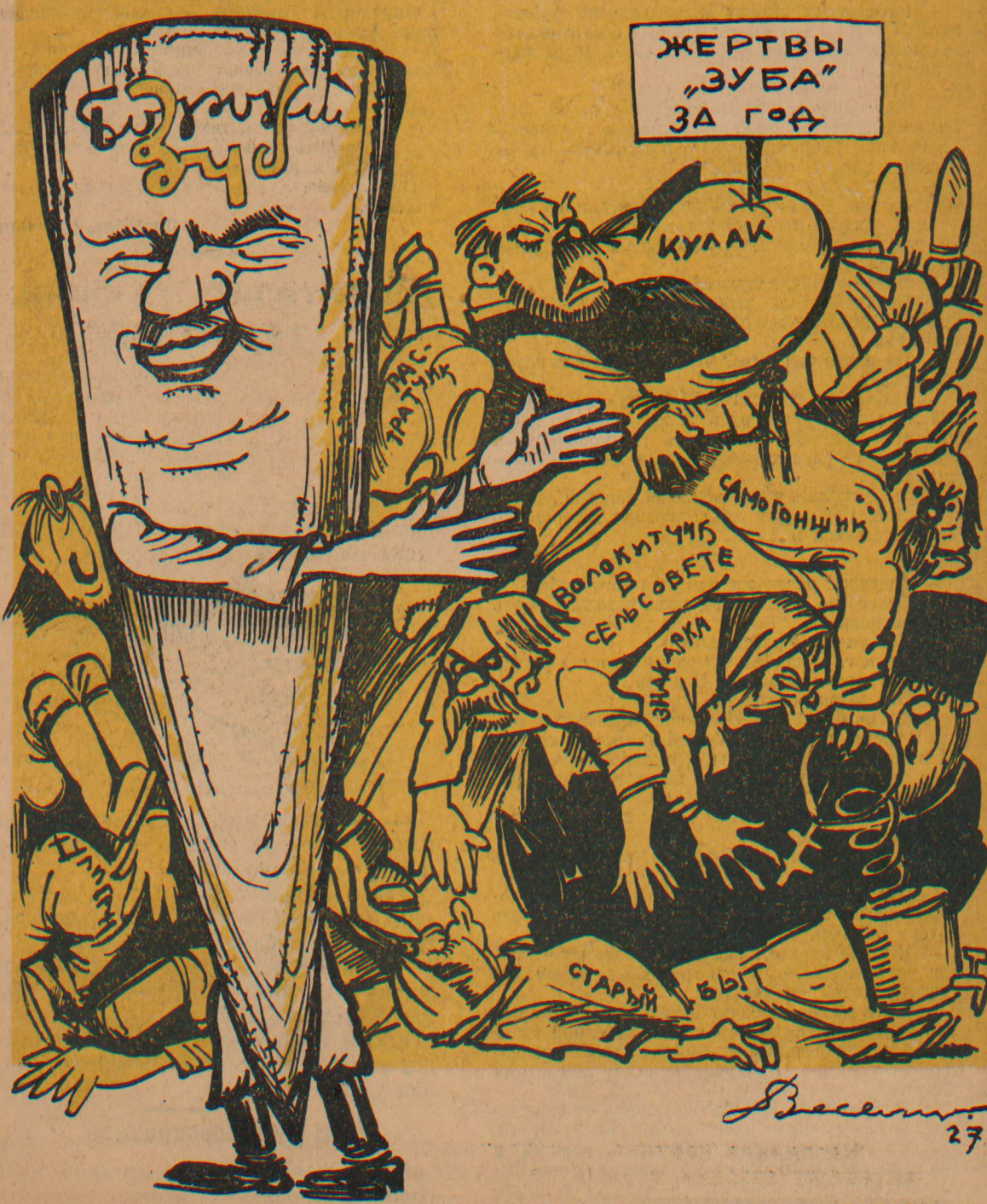
Исполнилась первая годовщина существования „Бороньего Зуба“.