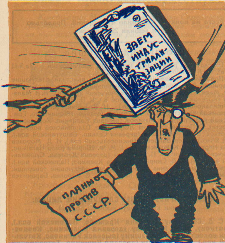
Рабочий ударил сильно,

Новый второй заем индустриализации народного хозяйства расхочится очень успешно.