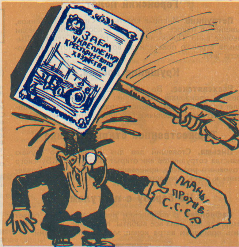
Крестьянин тоже от него не отстал,