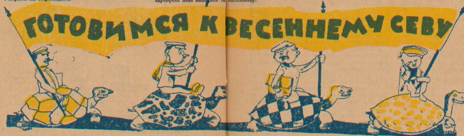
Рисунок на „Крокодил“

Дорожю длинной Вот шествуют чинно Четыре больших черепахи!