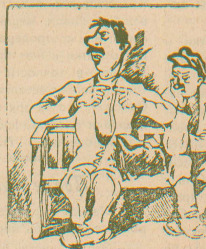
Вычистят, не вычистят...