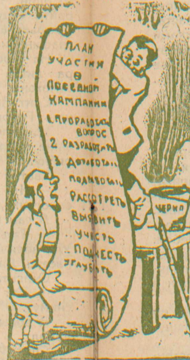
Не каждый от работы пьян. Иной работает, а другой еще только составляет план.

Подготовка к овному севу и везде идет хорошо.