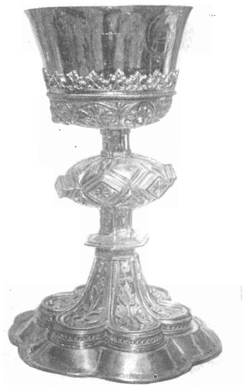
Потир. Костромской историко-архитектурный музей-заповедник