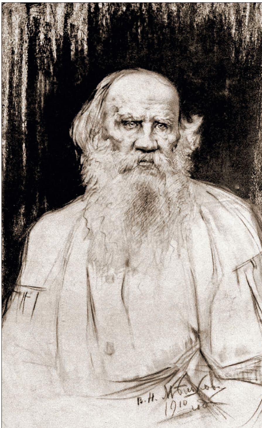
В.Н.Мешков. Портрет Л.Н.Толстого. 1910

Напомню замечательные её страницы. В роковую минуту смертельного ранения князь Андрей испытывает последний, страстный и мучительный порыв к жизни: «совершенно новым завистливым взглядом» он смотрит «на траву и полынь». И потом, уже на носилках, он задаётся мыслью: «Отчего мне так жалко расставаться с жизнью? Что-то было в этой жизни, чего я не понимал и не понимаю» 2 .