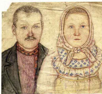
Е. В. Честняков. Семейный портрет. Б., цв. карт. 17,5 × 20,5

В родной природе, лицах земляков он чувствовал необыкновенную красоту и сумел создать в своих произведениях