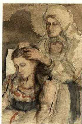
Е. В. Честняков. Прическа. Б., акв., кар. 13,5 × 10