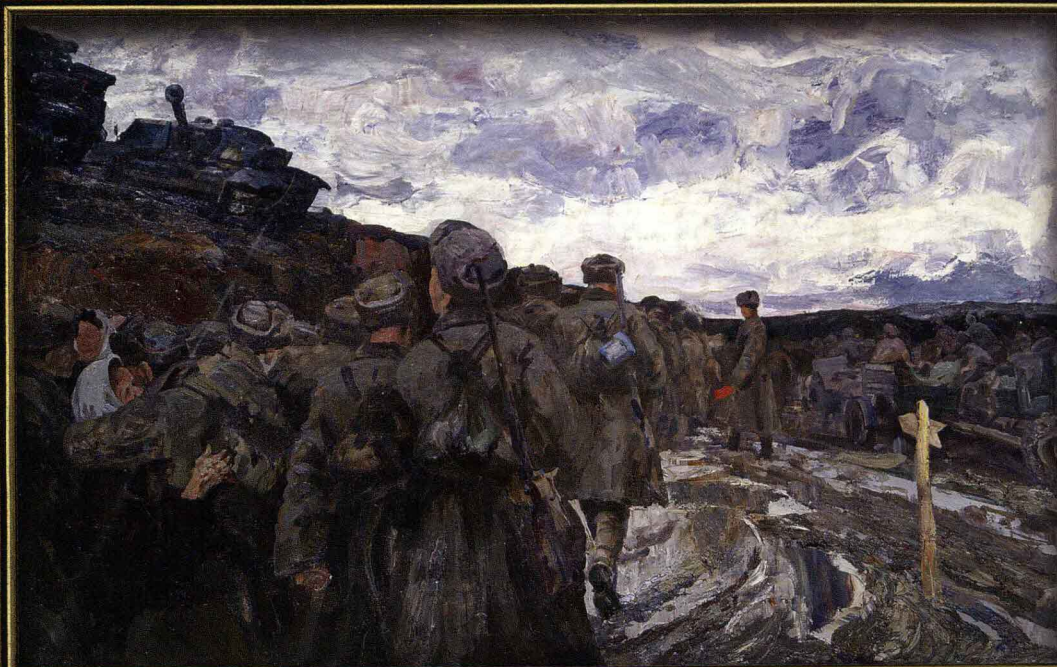
А. В. Овчаров (1926–1994). Идут на запад батальоны. 1981. Х., м. 120 × 180