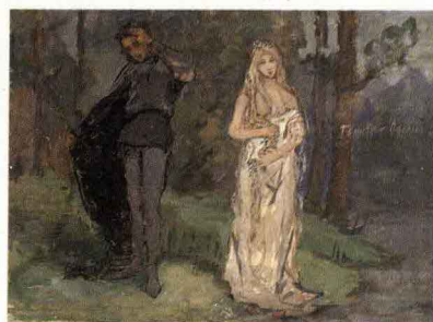
Е. В. Честняков. Гамлет и Офелия. Б., акв. 33 × 44,5

являлось наличие ценза — специального образования, которого у кологривского художника не было. Тем не менее Честняков не отступает от намеченной цели и в том же году начинает занятия в скульптурном музее Императорской Академии художеств, а также в мастерской живописи и рисования княгини М. К. Тенишевой 5 . Руководство мастерской осуществлял лично И. Е. Репин 6 . Не только живописные студии, но и музыкальные, литературные, танцевальные вечера, встречи с видными деятелями искусства создавали образ Тенишевской мастерской. В это время он сближается со студийцами И. Вилибиным, М. и В. Чемберс, С. Чехониным, В. Левитским, К. Траубенбергом, часто бывает в Эрмитаже, где одними из наиболее полюбившихся ему экспонатов стали небольшие терракотовые статуэтки из Танагры.