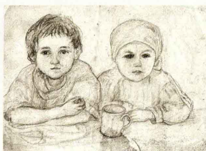
Е. В. Честняков. Мальчик и девочка с кружкой. Б., кар. 16,5 × 24