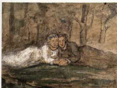
Е. В. Честняков. Влюбленные. Б., акв. 27 × 36