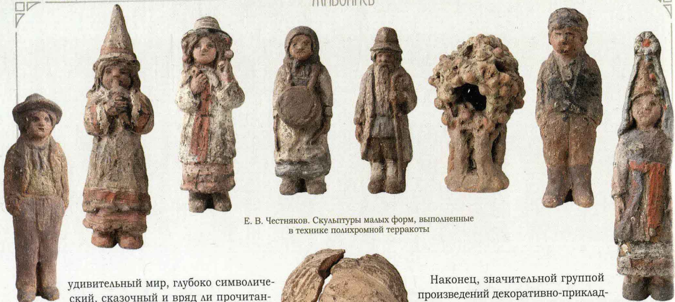
Е. В. Честняков. Скульптуры малых форм, выполненные в технике полихромной терракоты

удивительный мир, глубоко символический, сказочный и вряд ли прочитанный и познанный нами до конца 9 .