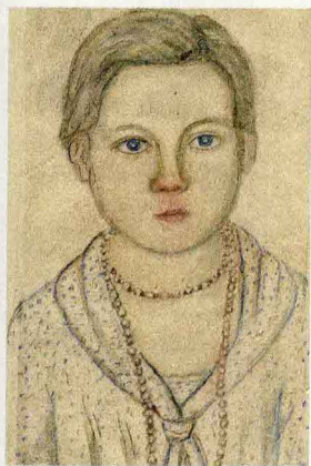
Е. В. Честняков. Девочка с бусами. Б., цв. кар. 15,5 × 9,5