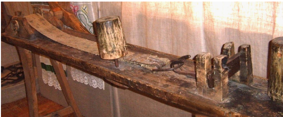
Рис. 1. Волочильная доска (цибанок) из дерева

Для волочения проволоки ювелиры использовали специальное устройство – цибанок, чье название в переводе с немецкого буквально означает «скамья». Внешне оно действительно очень похоже на длинную скамью с прорезью посредине, в которой движется бесконечная коленчатая цепь, перекинутая через два зубчатых колеса (рис. 1). По поверхности скамьи движутся крупные клещи, удерживающие проволоку. Цепь приводится в движение воротом с рукояткой и придает движение проволоке, во время которого она уменьшает свой диаметр. Таким образом мастера получают проволоку необходимой толщины.