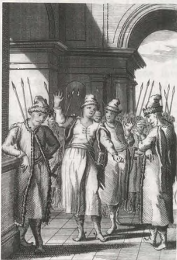
Рис. 3. Фронтиспис 1-го издания трагедии Сумарокова «Хореев» (1747 г.)

мысли об абсолютной самобытности и независимости его таланта (как национального самородка, опиравшегося только на «проявление самобытного инстинкта» [25] (рис. 3).