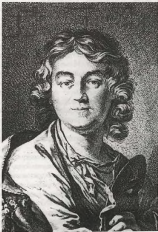
Рис. 1. Портрет Ф.Г.Волкова. Гравюра Е.П.Чемесова с оригинала А.П.Лосенко

Поехав в Кострому, я предполагала найти в архиве не только метрику о рождении Федора, но, может быть, и метрическую запись о смерти его отца (с указанием причины смерти) и еще какие-то факты, относящиеся к его семье. Но когда в августе 1982 г. я уже совсем собралась в поездку, пришла весть, что Костромской архив сгорел (он находился тогда в здании бывшей церкви).