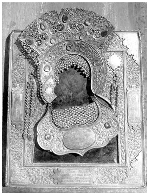
Феодоровский образ Божией Матери, считавшийся вкладом царя Михаила Феодоровича.