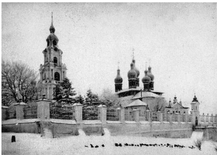
Успенский собор зимой. Открытка десятих годов XX века по фотографии А. Павловича.