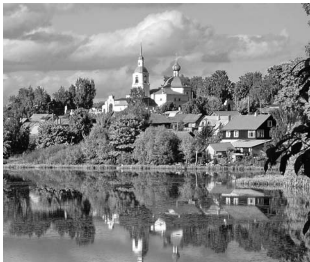
Село Селища на правом берегу Волги, ныне входящее в городскую черту Костромы. Фото 2006 года.