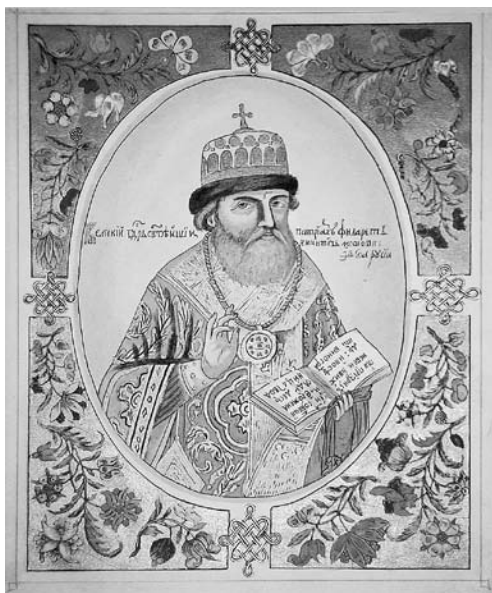
Патриарх Филарет. Портрет из «Царского титулярника» 1672 года.