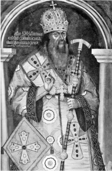
Патриарх Иоаким. Портрет 1678 года.

Кивоте и о Ея богонаписанном образе. Сия благочестивая двоица (царь и патриарх, сын с отцом) совет благ между собою сотвориша, еже бы им с чудотворнаго и святого Ея образа Феодоровскаго древняя олифа сняти: бе бо от многих лет престарелася вельми, и еже бы им обновити новою олифою» .