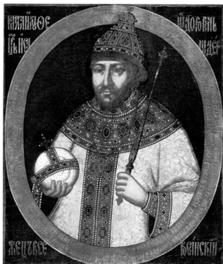
Царь Михаил Феодорович. Портрет восьмидесятых годов XVII века.

празднования в день явления иконы 15 августа, он, однако, повелел установить новый праздник в честь чудотворной иконы и приурочить этот праздник ко дню вступления своего на царство всероссийское, к 14 марта. Не сохранилось точных указаний, когда именно последовало повеление от царя об установлении нового праздника. Но нельзя сомневаться, что вскоре по воцарении, последовавшем 14 марта 1613 года. Все рукописные службы времен XVII века, относящиеся по содержанию ко дню явления иконы 15 августа, носят заглавие: «Служба 14 марта» 19 . Не без участия, конечно, совершилось установление нового праздника и со стороны отца царева святейшего патриарха Филарета и матери старицы Марфы Ивановны. Михаил Феодорович со своими родителями этим хотели и воздать Богу и Божией Матери благодарение за милость, и ознаменовать навеки день своего восшествия на престол. Действительно, этим праздником Михаил Феодорович увековечил свое имя в Костроме. Установленный им праздник 14 марта торжественно совершается в Костроме ежегодно вот уже почти 300 лет. Это один из самых больших костромских праздников с патриотическим оттенком, с молением за царя Михаила Феодоровича. Накануне за торжественной вечерней обязательно провозглашается Михаилу Феодоровичу вечная память. Праздник явления иконы 15 августа после установления праздника 14 марта отошел на второй план*.