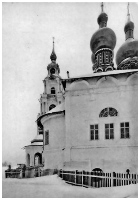
Вид Успенского собора. Открытка десятих годов XX века по фотографии А. Павловича.

Но, может быть, последний пожар, бывший 18 мая 1773 года, послужил к существенным изменениям в плане собора? Нет, и этот страшный пожар губительно отозвался только на внутренних поделках и движимом имуществе собора. Строительная комиссия по обновлению собора после пожара 1773 года в 1775 году доносила костромскому преосвященному о последствиях пожара, между прочим, следующее: во время пожара сгорели в соборе пол деревян-