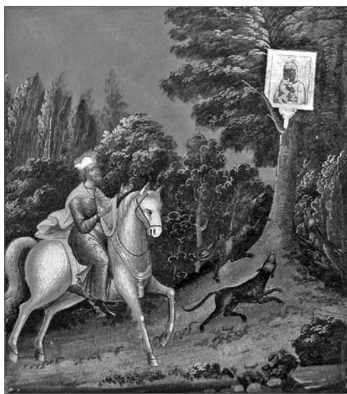
Явление чудотворной иконы князю Василию Ярославичу на охоте. Клеймо Феодоровской иконы Божией Матери письма XIX века.

Князь Василий Ярославич родился и стал костромским удельным князем в 1241 году. Икона явилась ему уже взрослому, когда он был уже в состоянии править княжеством сам, когда мог охотиться за зверями — словом, когда ему