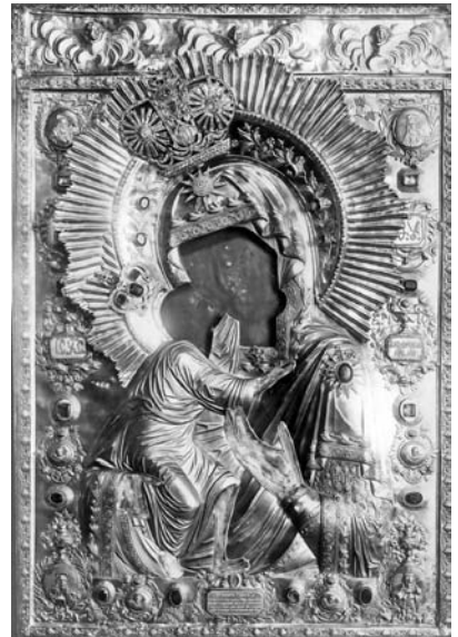
Чудотворная Феодоровская икона Божией Матери в начале XX века.

К нашему прискорбию, составители писцовых книг начала XVII века не имели своей задачей описывать собор со стороны архитектурного благоустройства. Внимание их было сосредоточено исключительно на движимом церковном имуществе, каковы; святые иконы, сосуды, ризы и так далее. Но и у них мимоходом встречаются некоторые указания на благоустройство собора со стороны планомерной и архитектурной. Из писцовых книг начала XVII века мы знаем, например, что Успенский собор был «каменный», что своды его изнутри поддерживаются колоннами, что в соборе для местных икон были иконостасы, были клиросы правый и левый, был придел Феодора Стратилата и так далее. Но опись 1702 года нам уже прямо с точностью свидетельствует о том, что собор был пятиглавый, окруженный с двух сто-