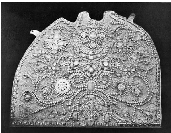
Цата, приклад царя Михаила Феодоровича к чудотворной Феодоровской иконе. Фото А. Шмидта, конец XIX века.